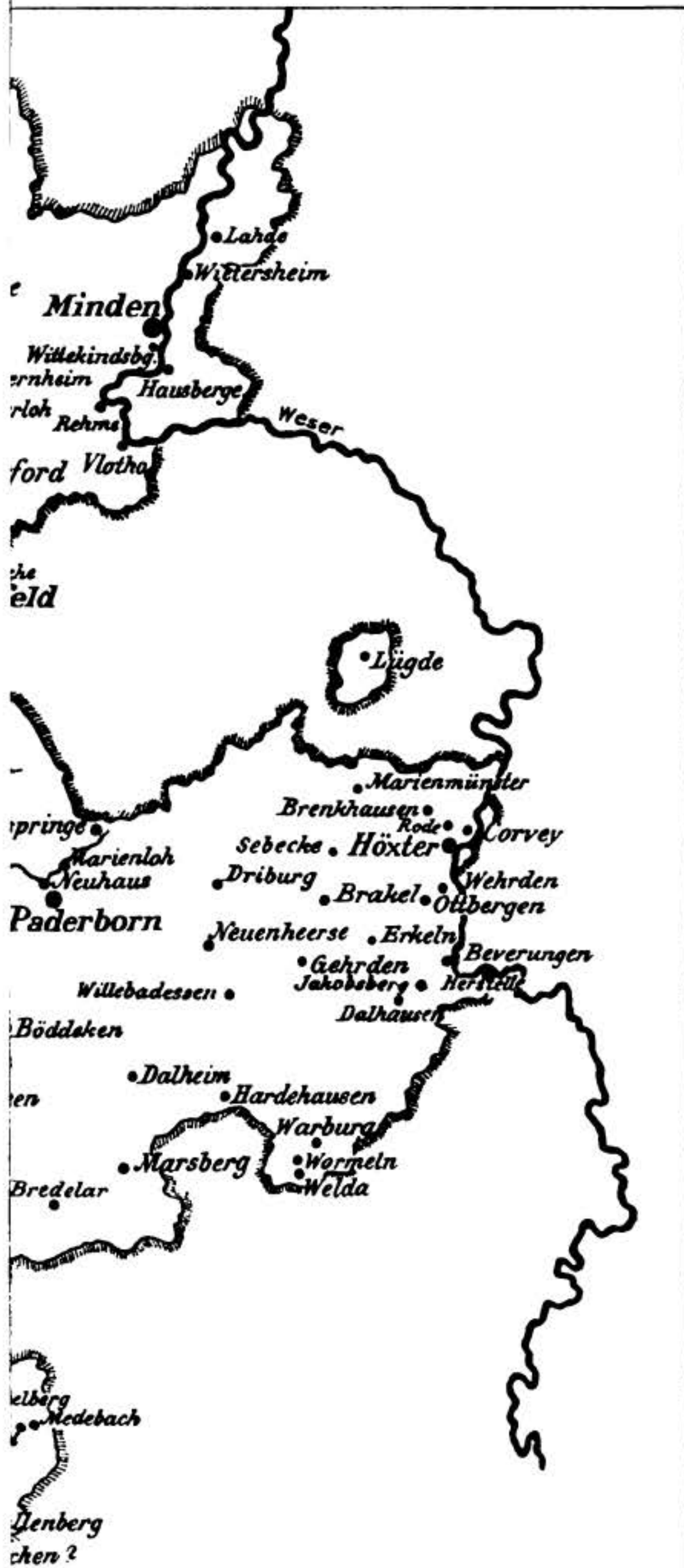
Die Klöster der Provinz Westfalen. Beikarte zu Schmitz-Kallenberg Monasticon Westfaliae.