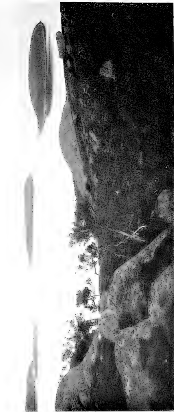
Кузова острова. Вершина острова Нѣмецкій Кузовъ.