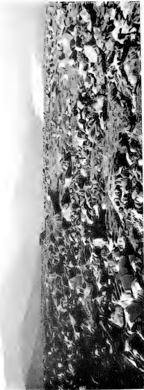
Юльскія горы. Чуна тундра.