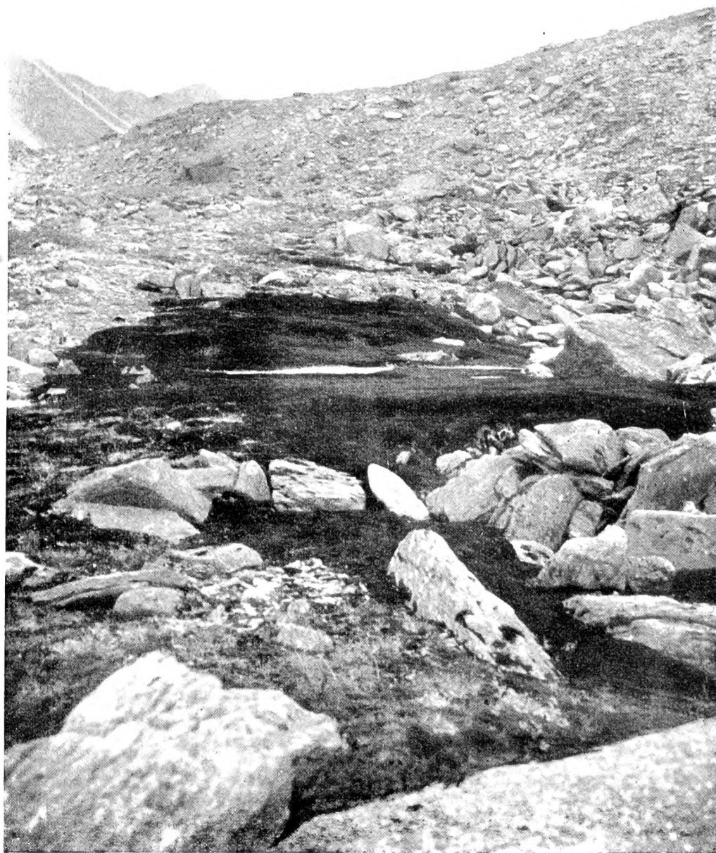
Заросли Polytrichum sexangulare Floerk. Хребетъ Тель-посъ, альпійская область.