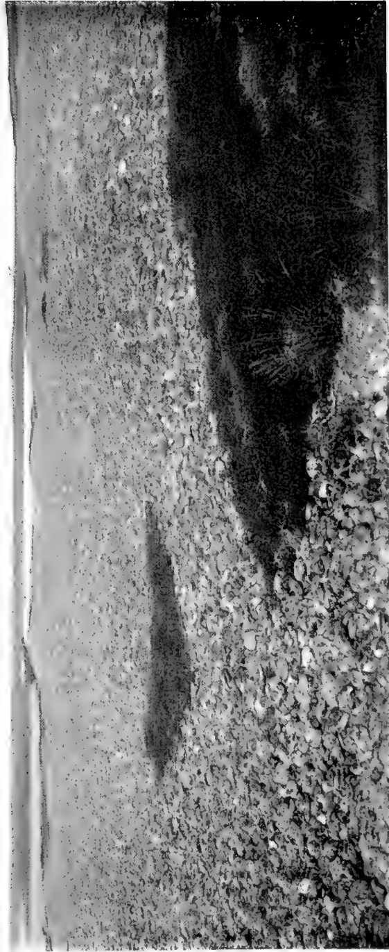
Соловецкіе острова. Островъ Большой Заицкій.