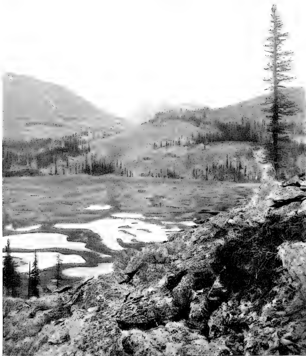
Сѣверный Уралъ. Хребетъ Сабля.