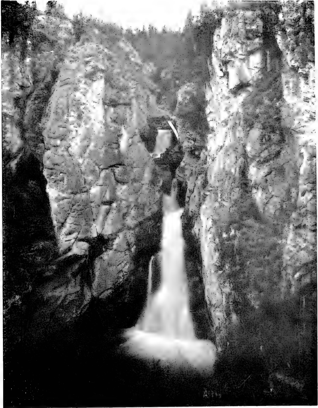
Печорскій край, Вологодской губ. Известковья скалы у ручья Велдоръ-кырта-іоль.