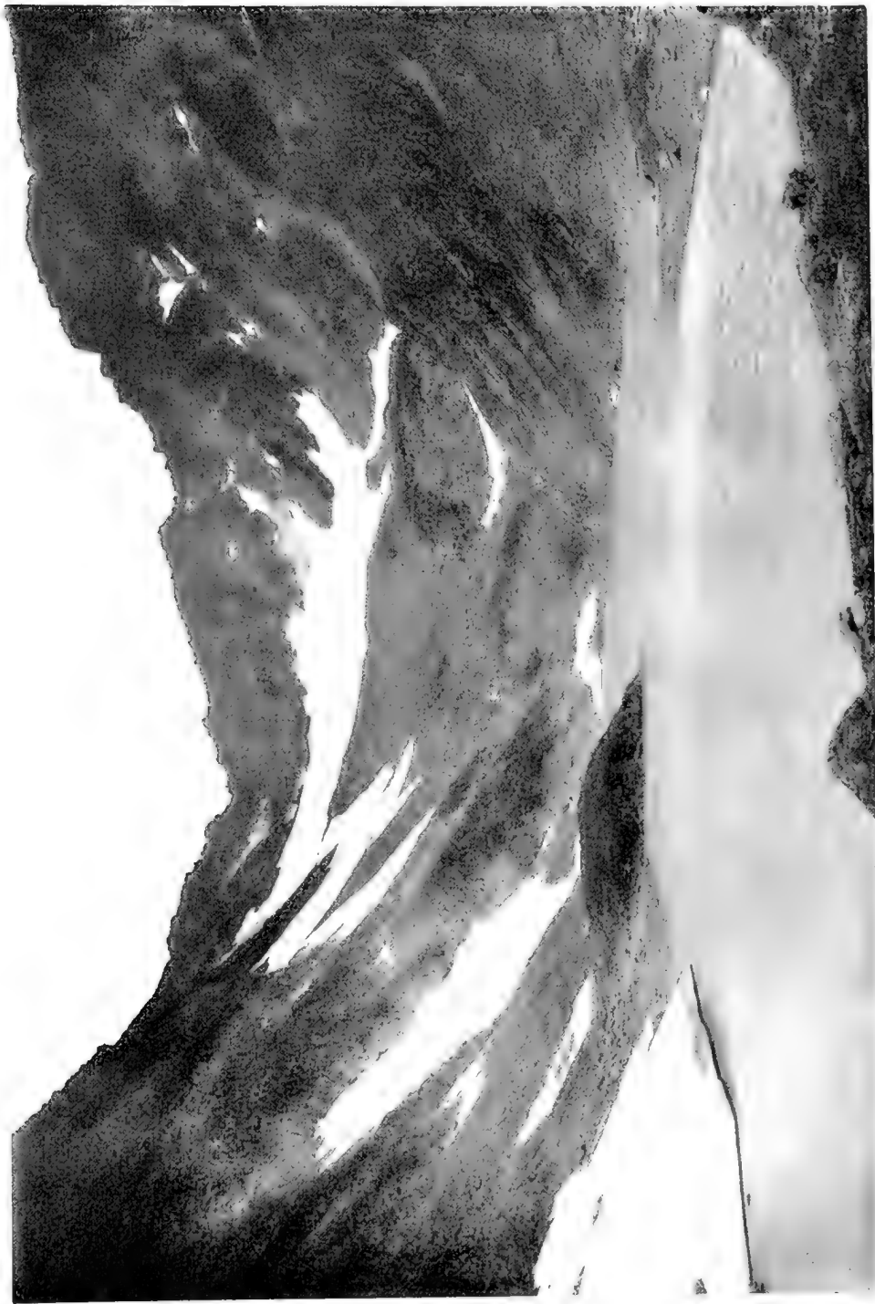
Съверный Уралъ. Хребетъ Тель-посъ.