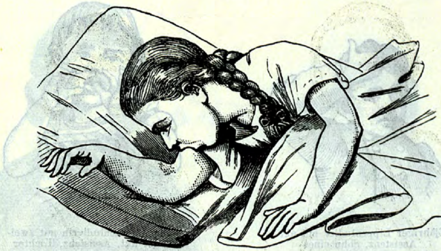
10jährige Armludlerin, Kaufmannstochter

legenheitsludlern, d. h. zu solchen, welche nur dann lutschen, wenn sie gerade ihres speziellen Ludels habhaft werden, ohne zu einer andern Zeit nach ihm Verlangen zu tragen. (Siehe übrigens auch Fig. 14.)