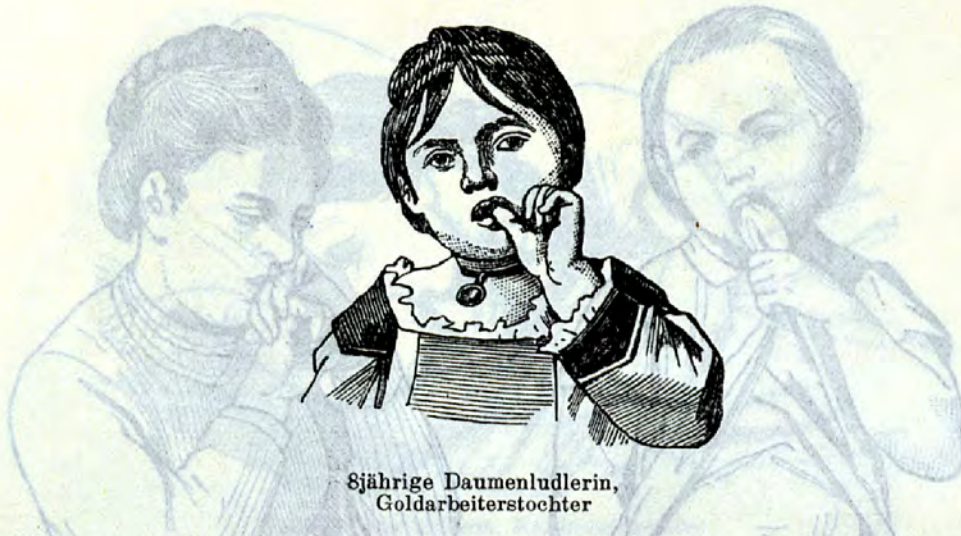
8jährige Daumenludlerin, Goldarbeiterstochter

Solche, die an ihren eigenen Körperteilen zu saugen pflegen, wählen hiezu sehr häufig — wie der alte Gott Horus — einen Daumen, und zwar öfters den rechten, seltener zwei oder drei Finger von einer und derselben Hand, und zwar einen Zeige- und Mittelfinger, dann und wann einen Zeige- und Goldfinger, oder die drei mittleren Finger, am allerseltensten jedoch eine große Zehe. Die letzten in diesem Bunde sind die wenigen, welche einen Handrücken oder Arm benutzen. So erhalten wir Finger-, beziehentlich Daumen-, Handrücken- und Armludler (Fig. 3 bis 5) 5)