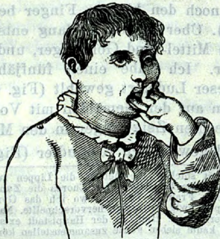
Fingerludler. mit der Flachhand nach vorn