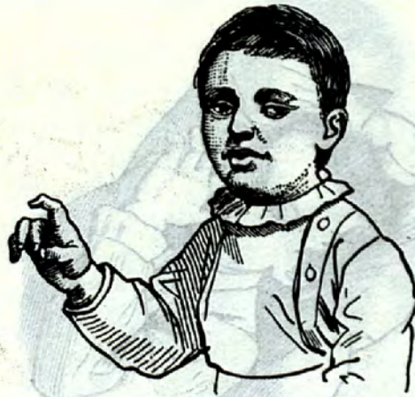
8jähriger Lippenludler m. d. Vergnügungsp. in der aktiven Aushilfshand, Goldarbeiterssohn

ist eine Zungenludlerin mit aus der Maske entstandener aktiver Assistenz geworden.