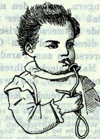
20 M alter Ludler an einem fremden Körper, Tischler- meisterssohn