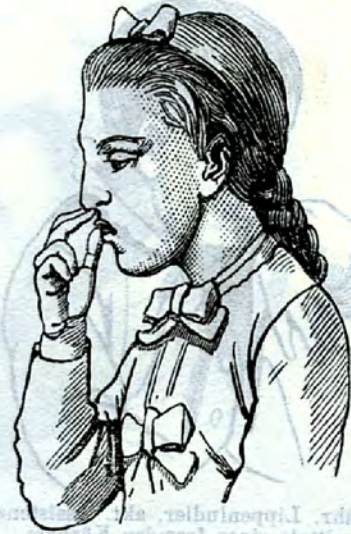
Ludlerin mit Maske

präpariert, dann nimmt er es aus dem Munde heraus und steckt es in ein Nasenloch, um von neuem an frischem Brote zu ludeln. So geht das fort, bis die Nase und beide Ohren mit eingespeicheltem Brote vollgepfropft sind. Erst jetzt kann er ruhig schlafen (Fig. 21).