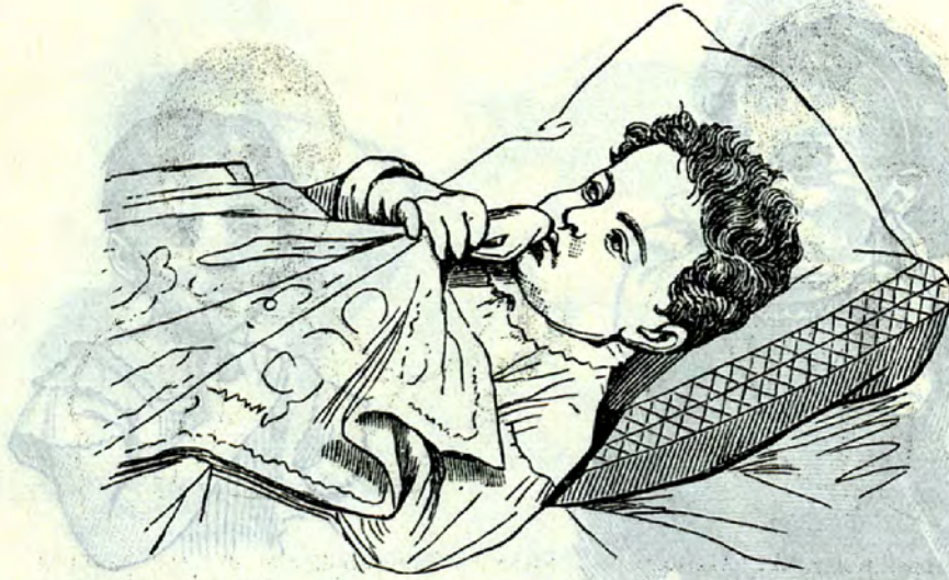
5jähriger Lippenludler, aktive Assistenz mittels eines fremden Körpers, Sohn eines Kaufmanns

aktiver Assistenz, welche den Zorn zu begleiten pflegt, als Reflex auslösen würde 11) .