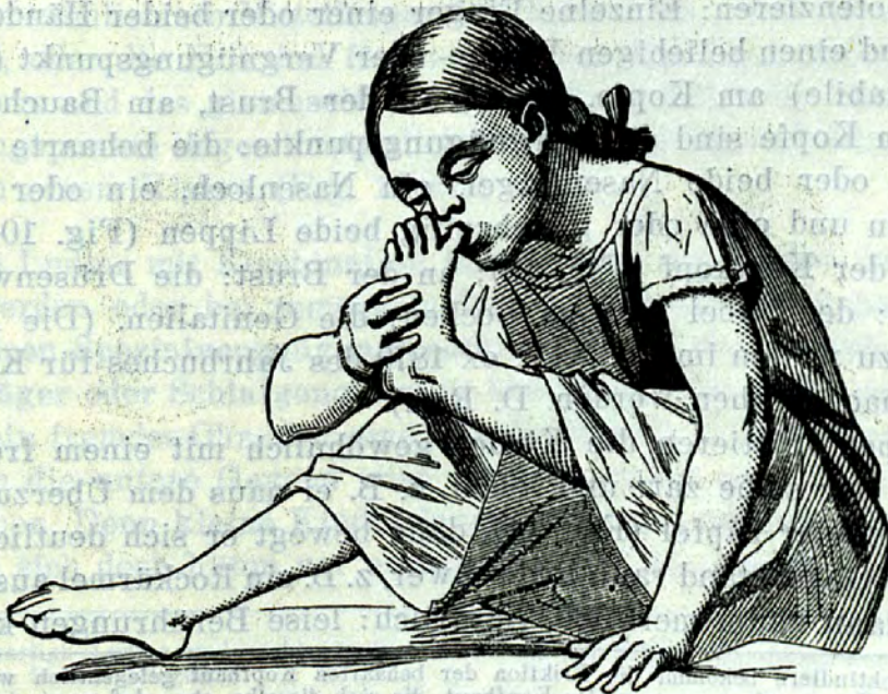
Daumenludlerin mit Wechsel im Ludel