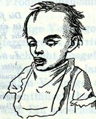
4jährige Zungenludlerin, Fleckenputzerstochter

bald fremde genieß- oder ungenießbare Gegenstände. Ist das Objekt genießbar, so beabsichtigt doch nie der daran Saugende, es früher oder später der Verdauung zu übergeben 4) .