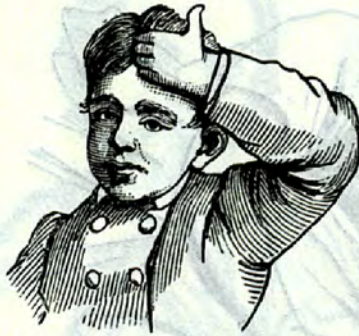
6jähriger Lippenludler mit akt. Assistenz, Sohn eines Schneiders