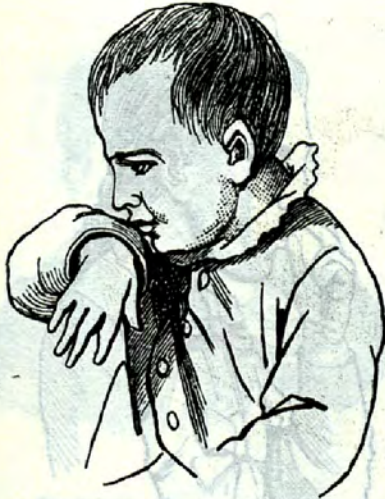
6jähr. Lippenludler, akt. Assistenz mittels eines fremden Körpers, Sohn eines Glasers