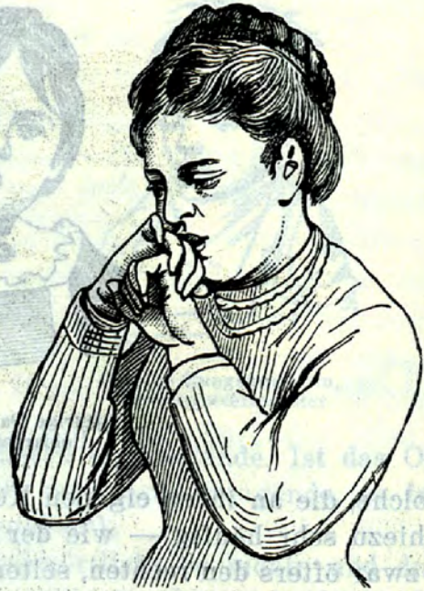
11jährige Handrückenludlerin, Tochter eines Chirurgen

oder sie lutschen an dem Mundstücke des ihrer Saugflasche angehörigen Kautschukschlauches (Fig. 7) oder endlich an einem Hemdzipfel (Fig. 8).