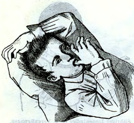
4jähr. Daumenludler mit. d. Vergnügungsp. in der akt. Aushilfshand, Sohn eines Kaffeesieders