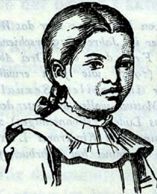
7½jährige Lippenludlerin, Tochter eines akad. Malers