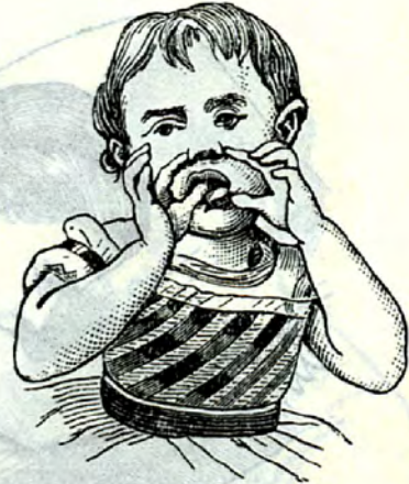
2 3 / 4 jähr. Daumenludlerin mit zwei- händiger akt. Assistenz, Tochter eines Arztes

Brotreste zwischen die Lippen nehmen, zu Gelegenheitsludlern an fremden Körpern. Auch am Handrücken und Arm pflegen die Lippenludler zu lutschen. Eine achtjährige Daumenludlerin, Tochter eines hiesigen Kaufmanns, hält sich in der Regel an den linken Daumen, ohne aber den rechten oder die linke Zehe zu verschmähen. Derartige Individuen, welche ihre Ludelweise ohne Zwang von außen zu ändern gewöhnt sind, heiße ich Ludler mit Wechsel im Ludel (Fig. 9).