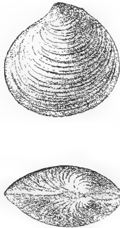
Lucina circulus n. sp.