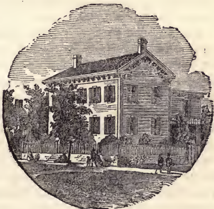
Lincoln's Haus in Springfield.

Der nächste Tag brachte nach Springfield das von der Convention ernannte Committee, um Lincoln offiziell von seiner Ernennung in Kenntniß zu setzen. Sie wurden von einer großen Masse Bürger bis zu seinem Hause geleitet. Ein Augenzeuge, der diesem denkwürdigen Besuch in dem einfachen, weißen, zweistöckigen hölzer-