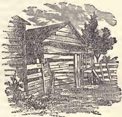
Lincoln's früheste Heimath in Kentucky.

haus errichten wollten. Auch Abe erhielt eine Art; und mit dem weitem Beistand eines Nachbarn hatte Lincoln in zwei bis drei Tagen ein zierliches Haus von etwa achtzehn Quadratsfuß, dessen Balken in der üblichen Weise durch Knoten befestigt waren, während die Lücken zwischen denselben mit Lehm ausgefüllt waren. Es hatte bloß Ein Zimmer; doch gaben einige oben über Balken gelegte Bretter weitere Räumlichkeiten, zu denen man mittelst einer rohen Leiter in der Ecke gelangte. Dann wurden von den beiden Ansiedlern, dem Vater und Sohn, ein Bett, ein Tisch und vier Stühle gemacht, und das Gebäude konnte dann bezogen werden. Der Boden war Abe's Schlafzimmer; und dort schlief Nacht für Nacht durch viele Jahre er, der jetzt die höchste Stelle bekleidet, welche das amerikanische Volk vergeben kann und der im Weißen Hause zu Washington wohnt, von jedem Comfort umgeben, welchen Reichthum und Macht geben kann, — mit einer rauhen Decke zur Matratze und einer andern zur Decke.