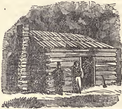
Lincoln's erstes Haus in Illinois.

Eisenbahnen unbekannt waren, wurde in fünfzehn Tagen gemacht. Sie führten ihre Waaren in großen, von Ochsen gezogenen Wagen mit, und Abraham selbst trieb eines der Gespanne. Sie hielten am Nordufer des Sangamon River an einem Platze, zehn Meilen westlich von Decatur, Illinois. Während sie durch das Marschland des Kaskaskia River zogen, mußten die Männer mehrere Fuß tief durch das Wasser waten. So wurde die Reise nicht ohne Hindernisse gemacht. Bei ihrer Ankunft wurde ein Blockhaus