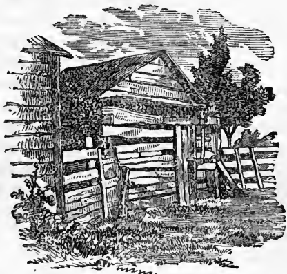
Lincoln's früheste Heimath in Kentucky.

haus errichten wollten. Auch Abe erhielt eine Art; und mit dem weitem Beistand eines Nachbarn hatte Lincoln in zwei bis drei Tagen ein zierliches Haus von etwa achtzehn Quadratsfuß, dessen Balken in der üblichen Weise durch Knoten befestigt waren, während die Lücken zwischen denselben mit Lehm ausgefüllt waren. Es hatte bloß Ein Zimmer; doch gaben einige oben über Balken gelegte Bretter weitere Räumlichkeiten, zu denen man mittelst einer rohen Leiter in der Ecke gelangte. Dann wurden von den beiden Ansiedlern, dem Vater und Sohn, ein Bett, ein Tisch und vier Stühle gemacht, und das Gebäude konnte dann bezogen werden. Der Boden war Abe's Schlafzimmer; und dort schlief Nacht für Nacht durch viele Jahre er, der jetzt die höchste Stelle bekleidet, welche das amerikanische Volk vergeben kann und der im Weißen Hause zu Washington wohnt, von jedem Comfort umgeben, welchen Reichthum und Macht geben kann, — mit einer rauhen Decke zur Matratze und einer andern zur Decke.