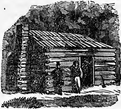
Lincoln's erstes Haus in Illinois.

Eisenbahnen unbekannt waren, wurde in fünfzehn Tagen gemacht. Sie führten ihre Waaren in großen, von Ochsen gezogenen Wagen mit, und Abraham selbst trieb eines der Gespanne. Sie hielten am Nordufer des Sangamon River an einem Platze, zehn Meilen westlich von Decatur, Illinois. Während sie durch das Marschland des Kaskaskia River zogen, mußten die Männer mehrere Fuß tief durch das Wasser waten. So wurde die Reise nicht ohne Hindernisse gemacht. Bei ihrer Ankunft wurde ein Blockhaus