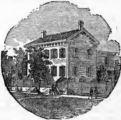
Lincoln's Haus in Springfield.

Der nächste Tag brachte nach Springfield das von der Convention ernannte Committee, um Lincoln offiziell von seiner Ernennung in Kenntniß zu setzen. Sie wurden von einer großen Masse Bürger bis zu seinem Hause geleitet. Ein Augenzeuge, der diesem denkwürdigen Besuch in dem einfachen, weißen, zweistöckigen hölzer-