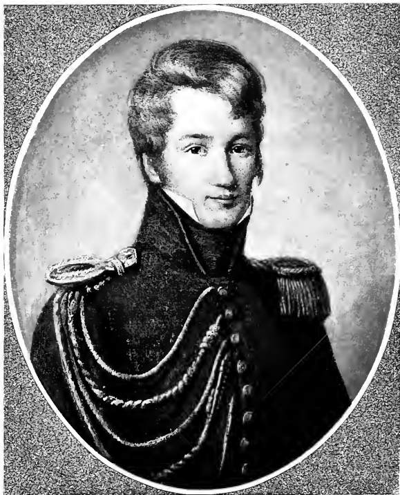
ALFRED DE VIGNY