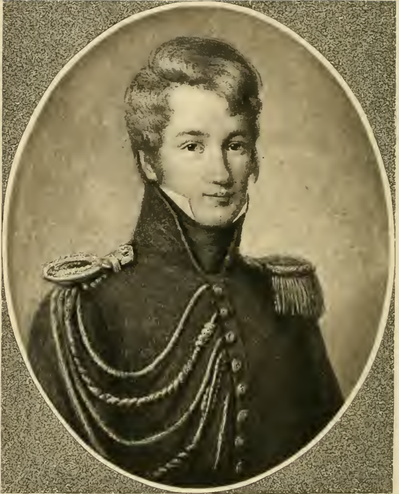
ALFRED DE VIGNY