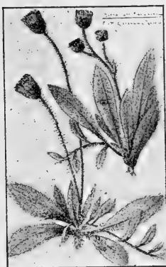
Hieracium Kneuckerianum nov. spec. hybr.

die beschriebene Pflanze von Deidesheim dargestellt wird. H. Kneuckerianum unterscheidet sich der Hauptsache nach von H. albipedunculum und von H. Heuffelii *) wie H. brachiatum von H. venetianum und H. adriaticum Ng. P., nämlich durch Anwesenheit von Stolonen. Ausserdem deuten die kugeligen Köpfe, die breitlichen Hüllschuppen und die starke Rotstreifung der Randblüten in weit höherem Grade auf die Einwirkung von H. Pilosella hin, als es bei H. albipedunculum und H. Heuffelii der Fall ist.