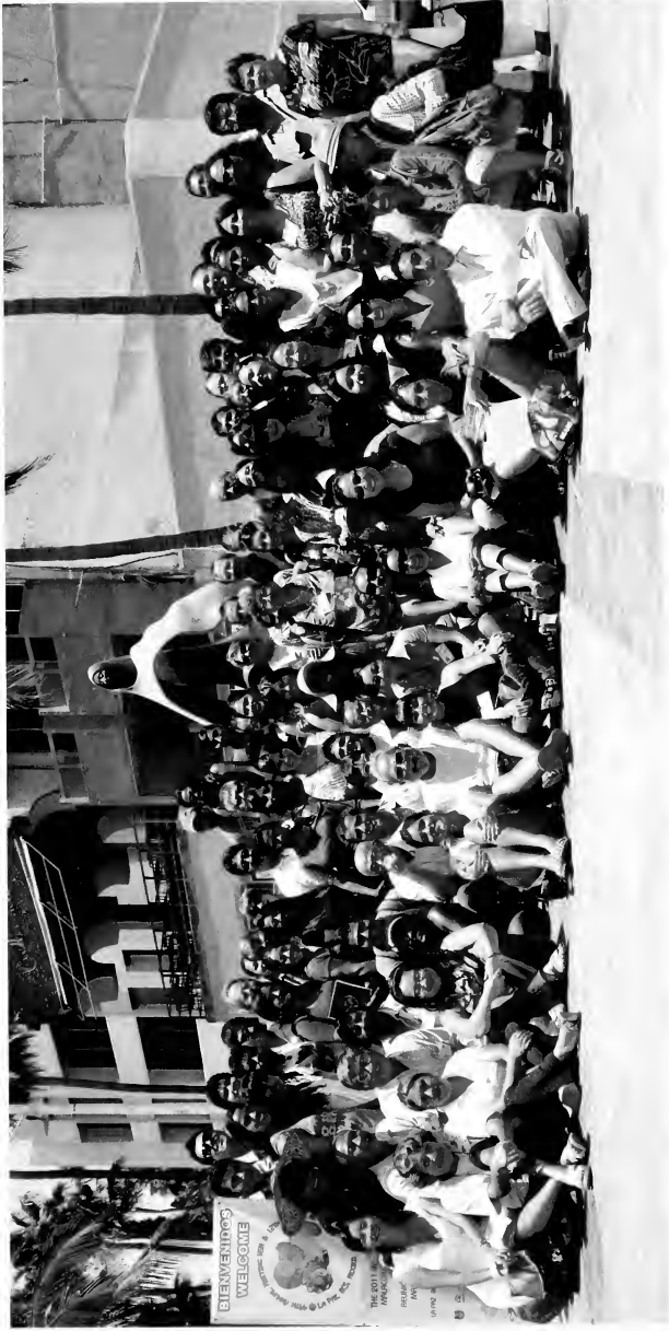
Western Society of Malacologists – Sociedad Mexicana de Malacología group meeting photograph June, 2011