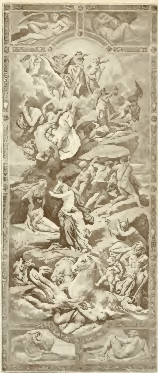
Titanenkrieg: Götter und Titanen