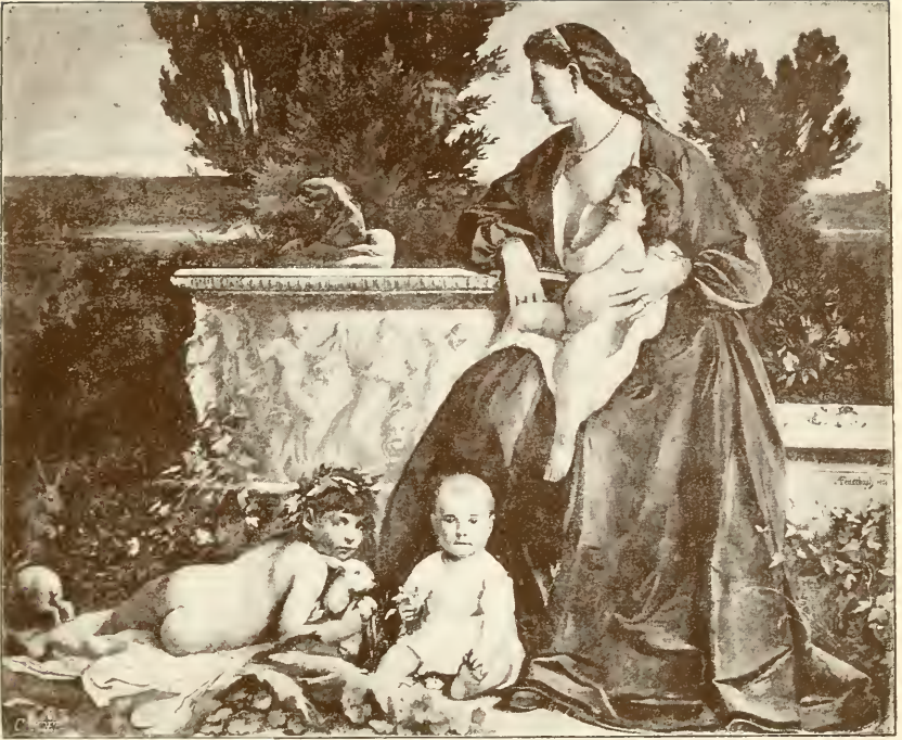
Familie am Brunnen