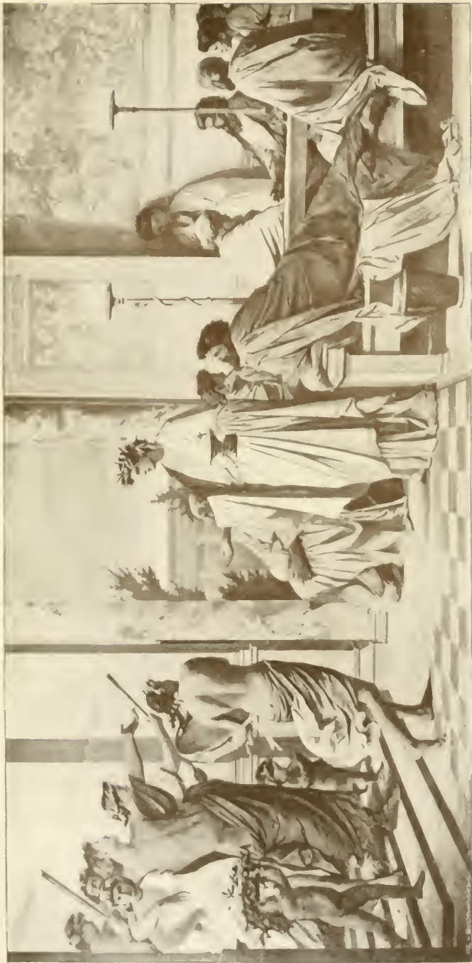
Gastmahl des Platon