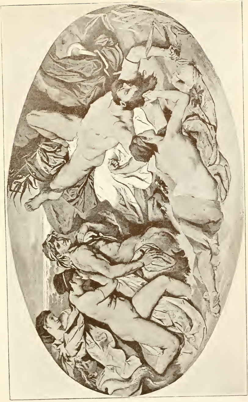
Prometheus und die Okeaniden