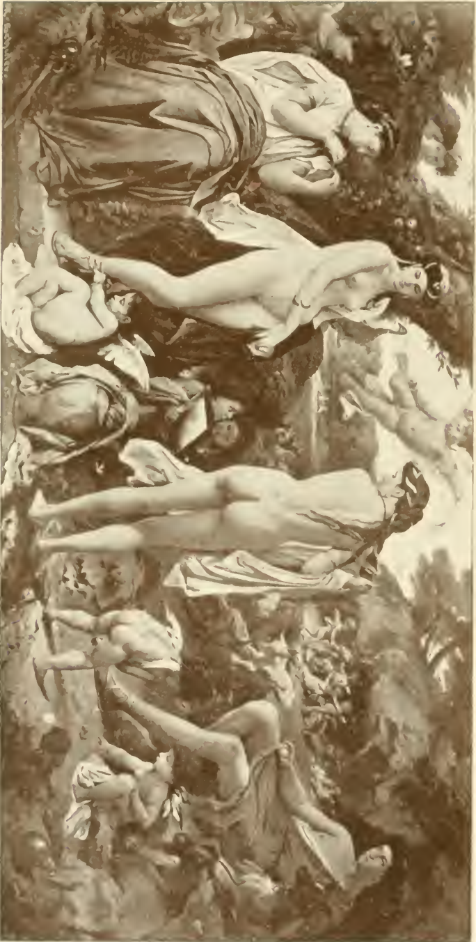
Oréal des Paris