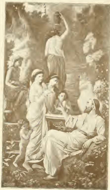
Hafis am Brunnen