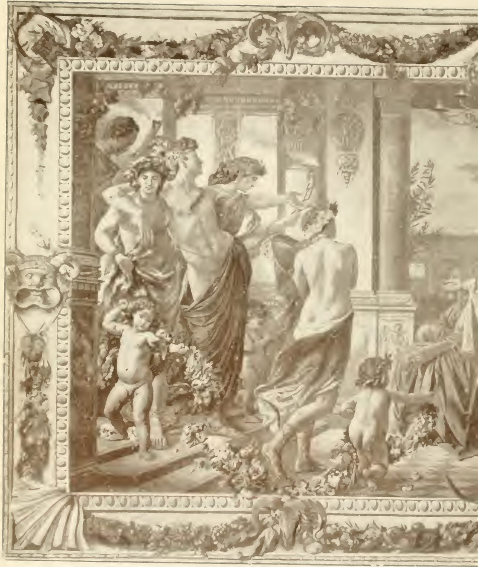
Zweites Gemälde des Platon