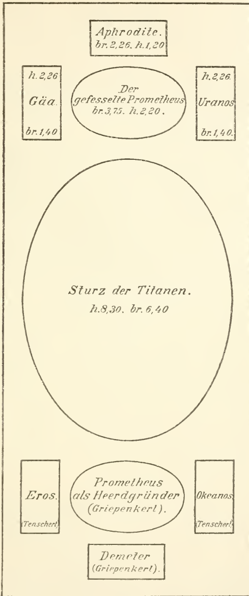
Feuerbachs Deckeneinteilung der Aula der k. k. Akademie in Wien.