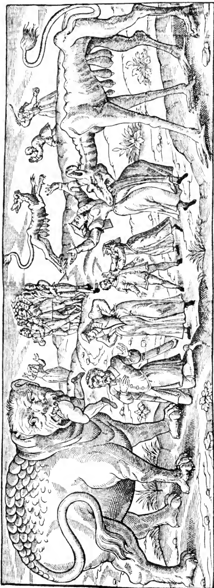
Histoire facecieuse de la Bigorne, qui ne vit que de bons Hommes. Et la Chiche-Face qui ne vit que de bonnes Femmes.