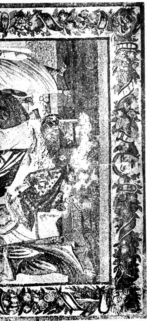
Mosaikbild der Schule von Athen.