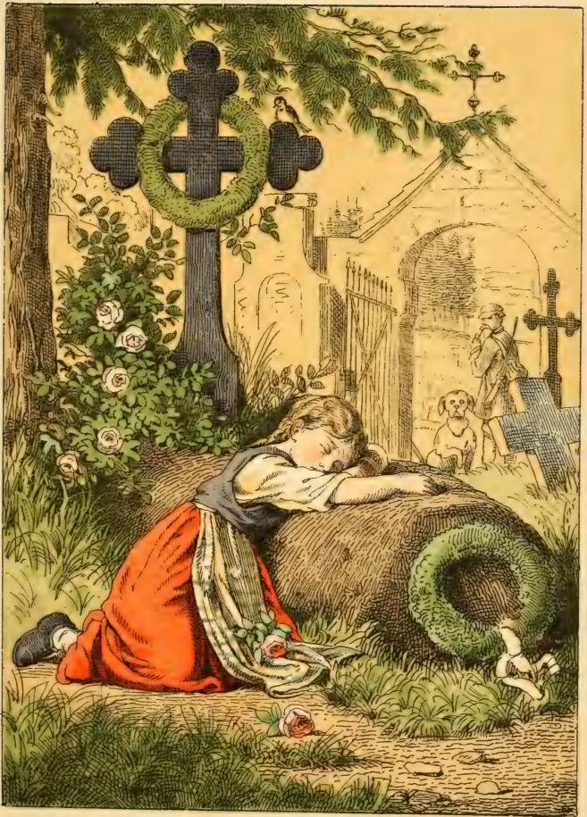
Das Vaterhaus. (Jf. Braun's ges. Erzählungen. VI.)