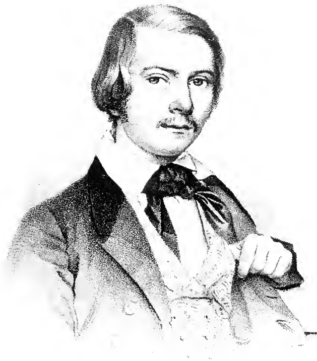
Carl Boell 1839.