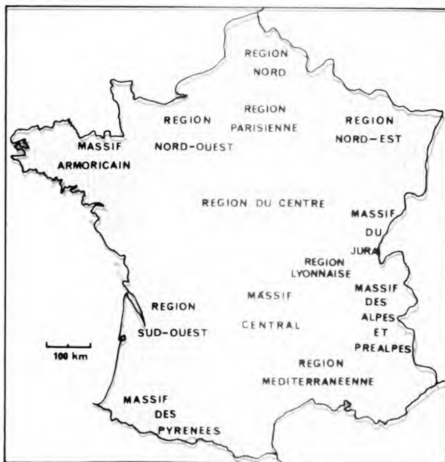
MASSIFS ET REGIONS