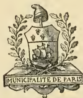
Armes de la Municipalité de Paris, en 1790

TOME DEUXIÈME ORGANISATION ET RÔLE POLITIQUES DE PARIS