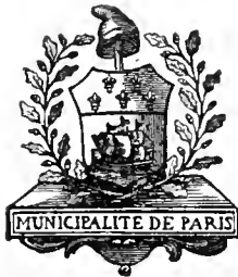
Armes de la Municipalité de Paris, en 1790

PARIS HORS LES MURS. — ADDITIONS ET CORRECTIONS