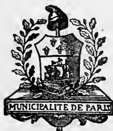
Armes de la Municipalité de Paris, en 1790

PARIS HORS LES MURS. — ADDITIONS ET CORRECTIONS