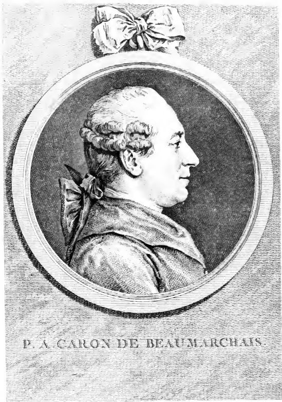
P. A. CARON DE BEAUMARCHAIS.