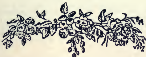
TABLE DES OUVRAGES CITÉS