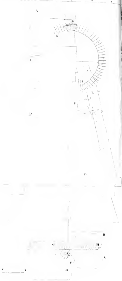
Macchina da sgarnare di Haas.