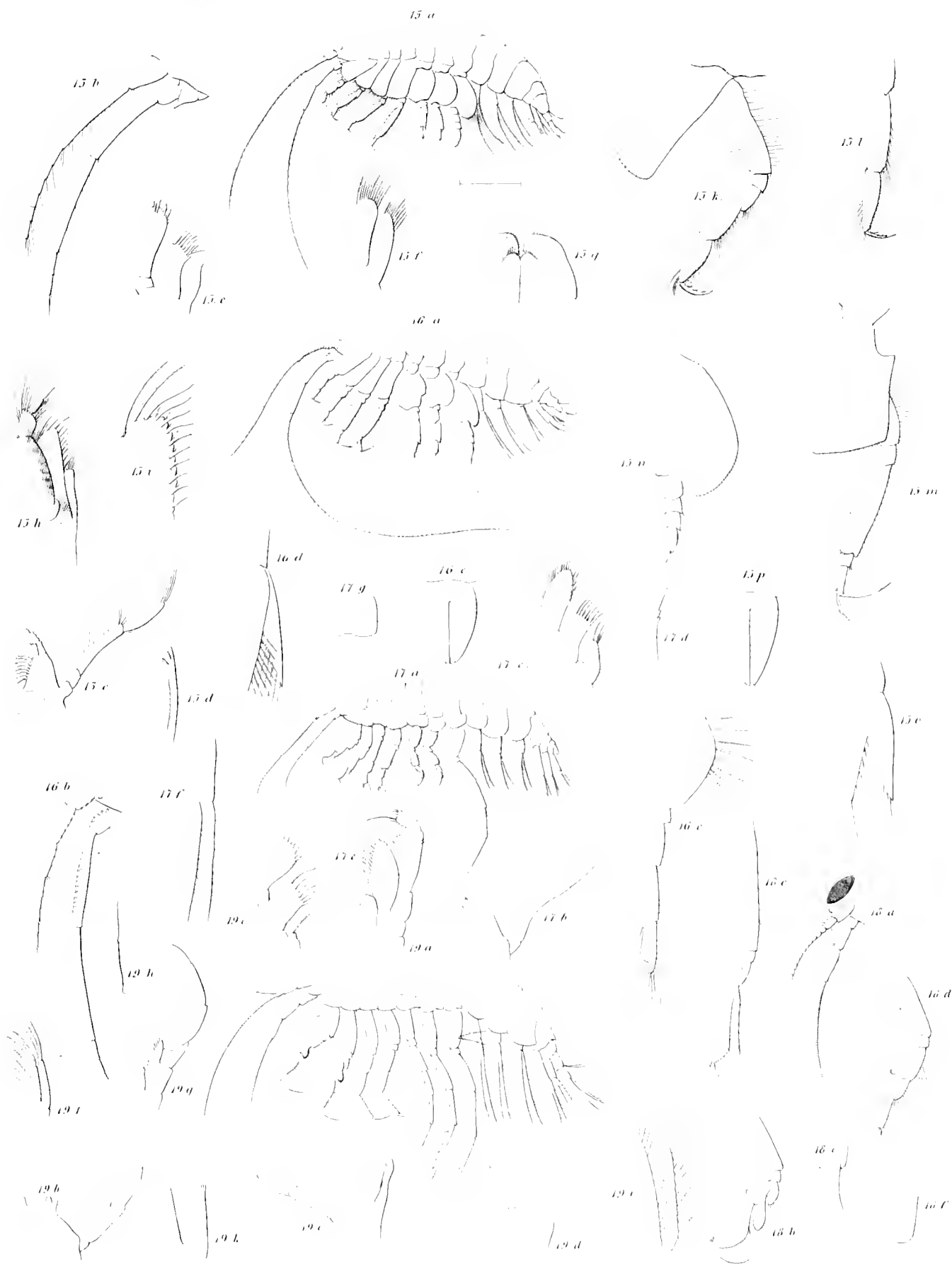
Fig. 15. Ampelisca aquicornis . Fig. 16. Ampelisca carinata . Fig. 17. Oediceros obtusus . Fig. 18. Oediceros altus .