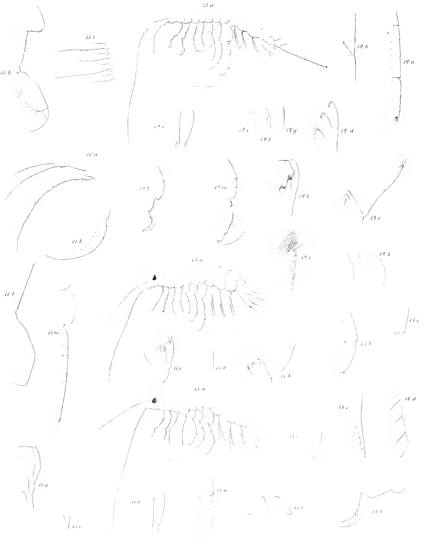
Fig 11 Gammarus brevicornis n Fig 12 Eriopis elongata n Fig 13 Paramphithoe tridentata n