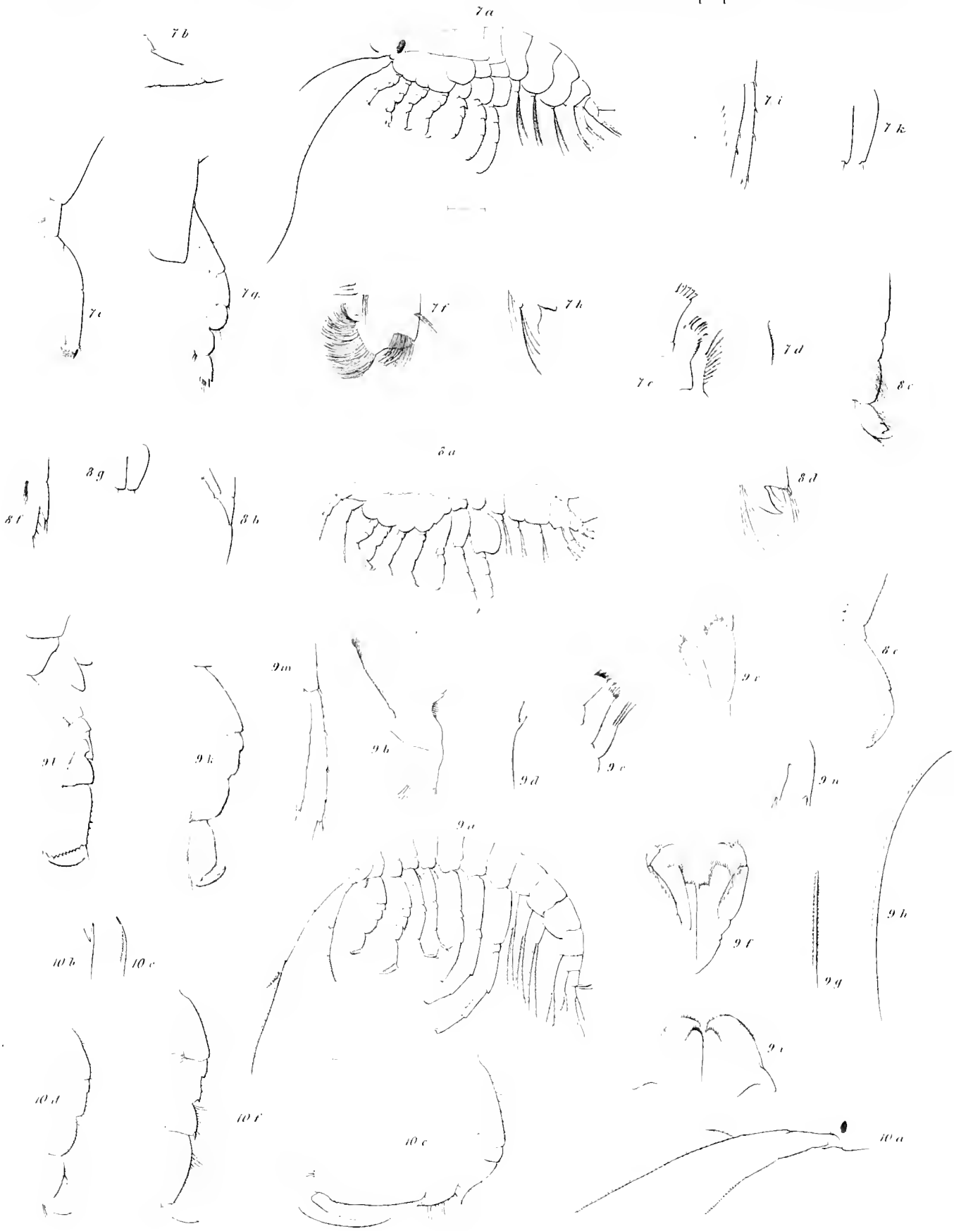
Fig 7 Anonyx Kroveri n Fig 8 Pontoporeia funcigera n Fig 9 Gammarus Loveni n Fig 10 Gammarus lavis n