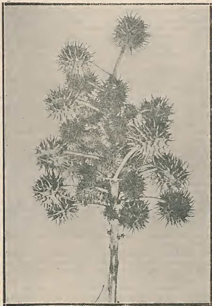
FIG. 1 — Infrutescência de mamoneira atacada de môfo cinzento. Os fructos atacados não se desenvolveram (Phot. Bitancourt).

dos, quando ligeiramente agitados, esporos esses que são levados pelo vento, pelos insectos e por outros meios a grandes distancias, a doença