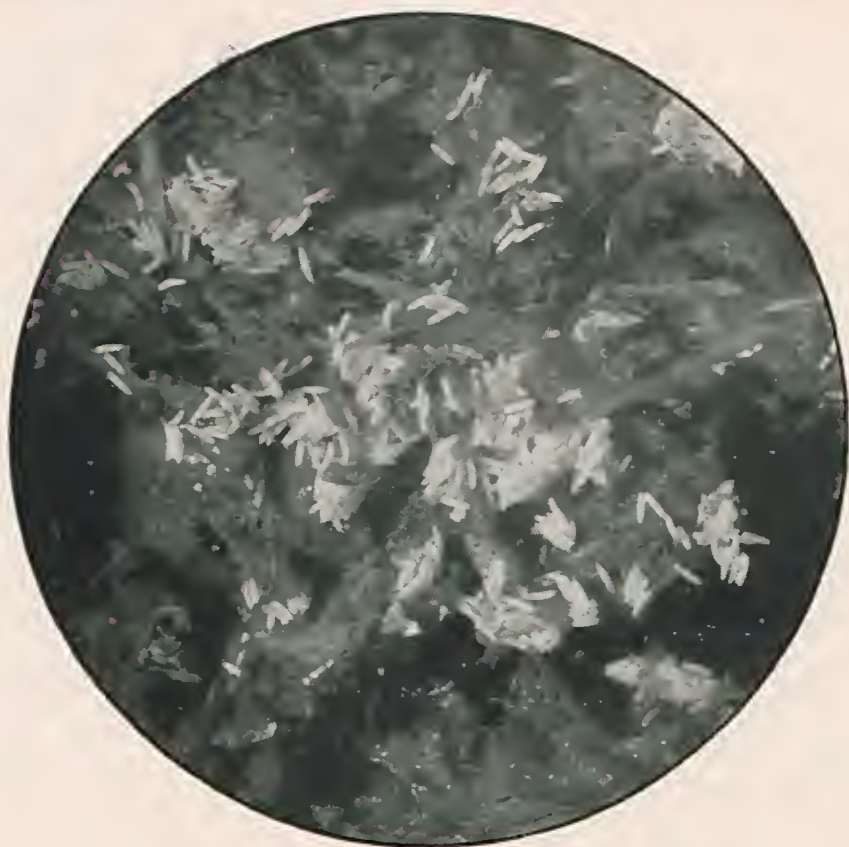
Fig. 1 — Desova da mosca domestica em fezes de cavallo. (Augmento de 2,5 vezes).