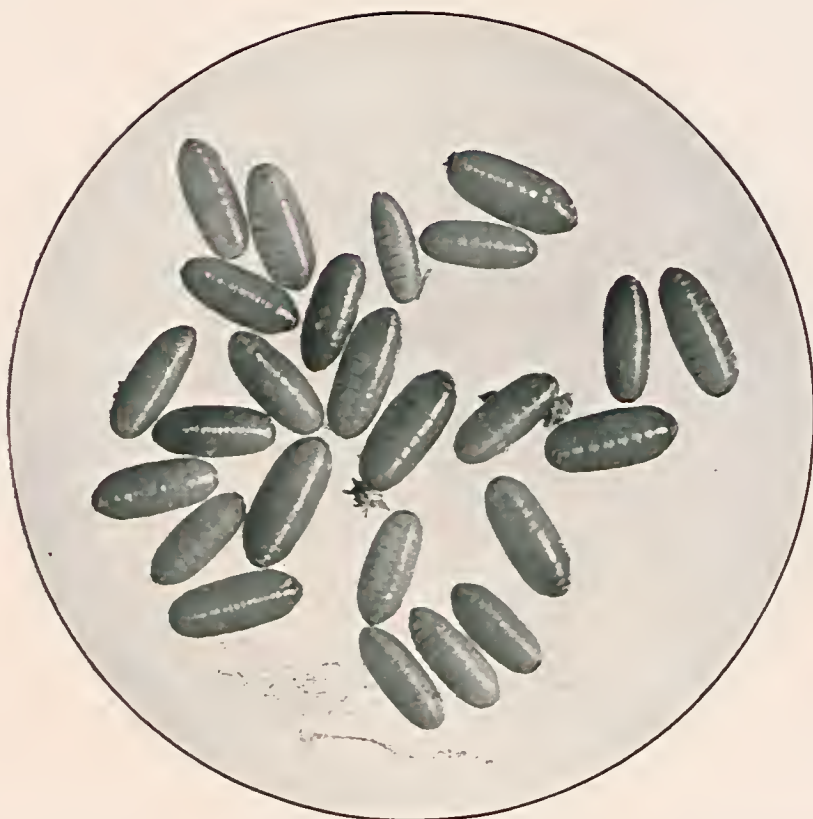
Fig. 4 — Pupas de mosca domestica. (Augmento de 2,5 vezes).