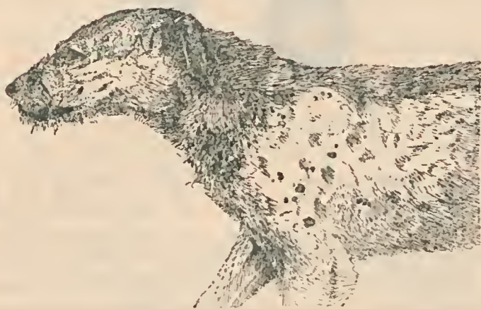
Fig. 4 — Depillação generalizada commum na sarna benigna e não tratada.

Quando se desconfia que um cão está atacado de sarna sempre se deve examinar a parte inferior da margem posterior das orelhas. Nessa região a sarna provoca um grande numero de pequenas saliencias do tamanho de grãos de areia, de modo que, quando se aperta e se passa essa região entre os dedos, se tem uma sensação de uma aspereza semelhante á de uma superficie granulosa. Este signal é constante e tem a vantagem de apparecer precocemente, permittindo o reconhecimento da doença em inicio. Nos cães novos a sarna differe da sarna dos cães