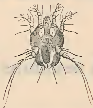
Fig. 3 — Otodectes cynotis , parasito causador da sarna do conducto auditivo externo dos cães.

quenas crostas salientes e de côr parda as quaes se iniciam de preferencia na borda posterior da orelha e nas pregas do cotovello (isto é, no recesso existente na parte posterior do ponto de implantação dos membros anteriores) de onde, via de regra, ellas se generalizam espalhando-se pela cabeça e pelo thorax (fig. 4).