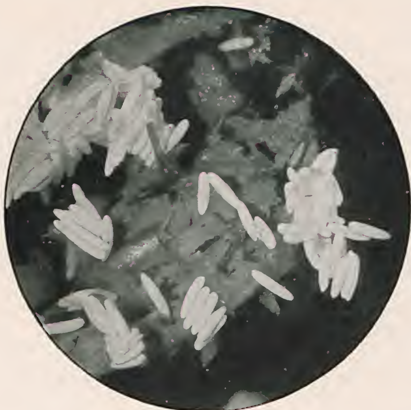
Fig. 2 — Ovos de mosca domestica. (Augmento de 7,5 vezes).