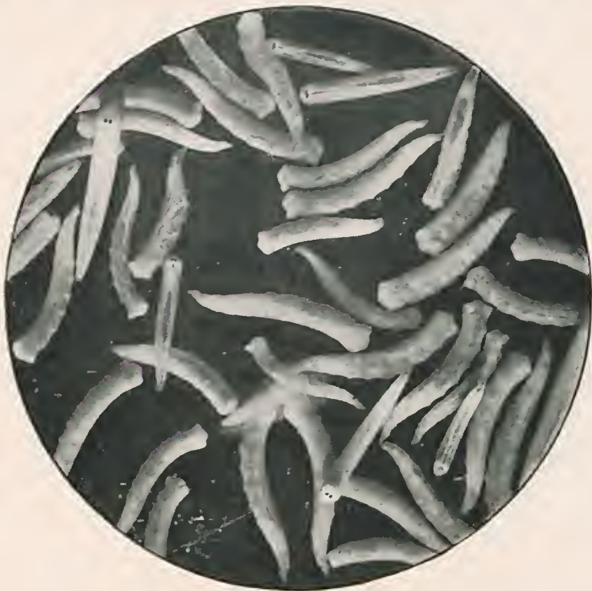
Fig. 3 — Larvas de mosca domestica. (Augmento de 2,5 vezes).