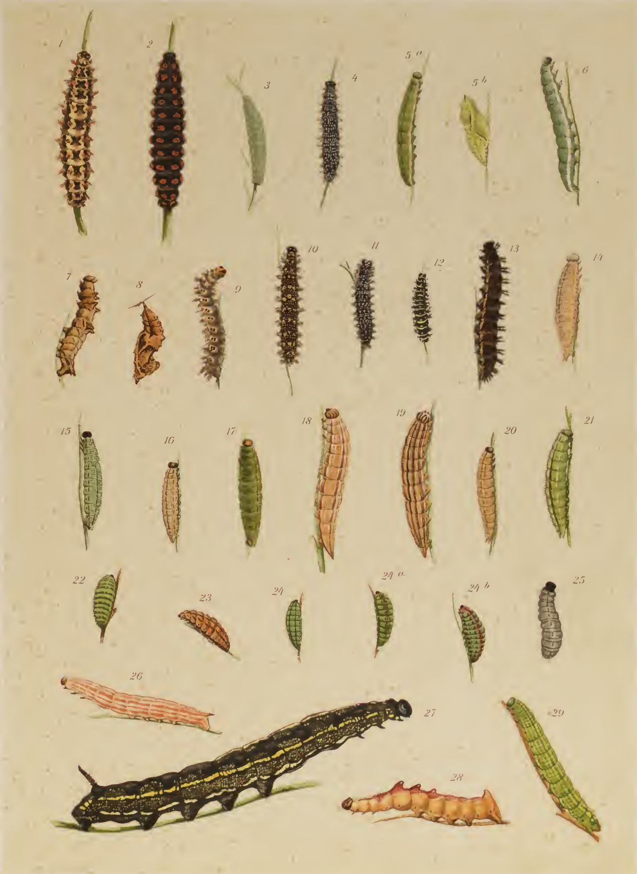
J. Griebel del.