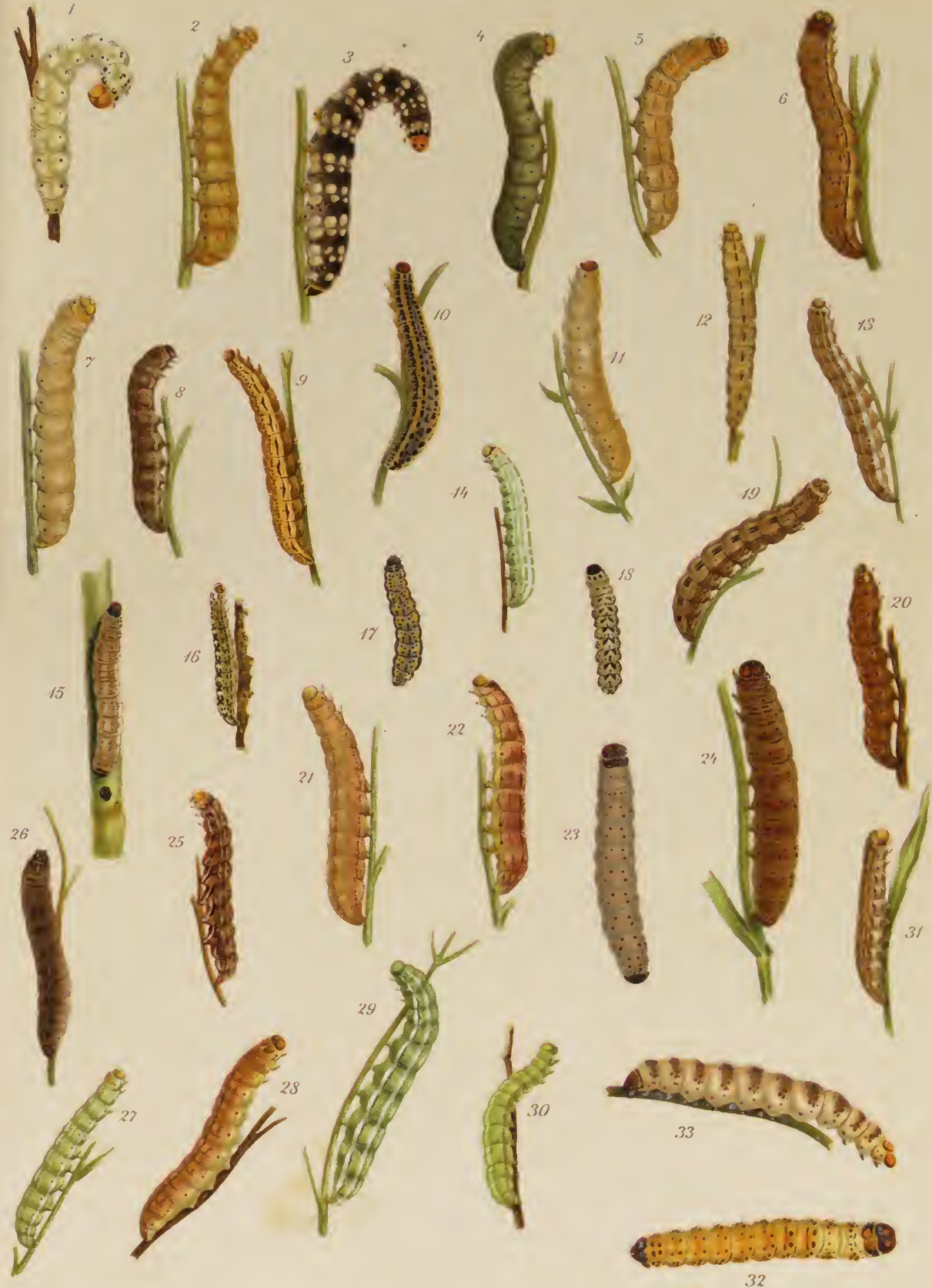
J. Gmelin del