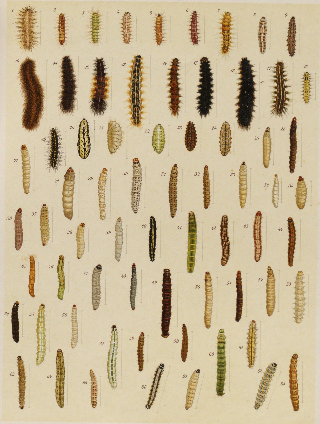
J. Griebel del.