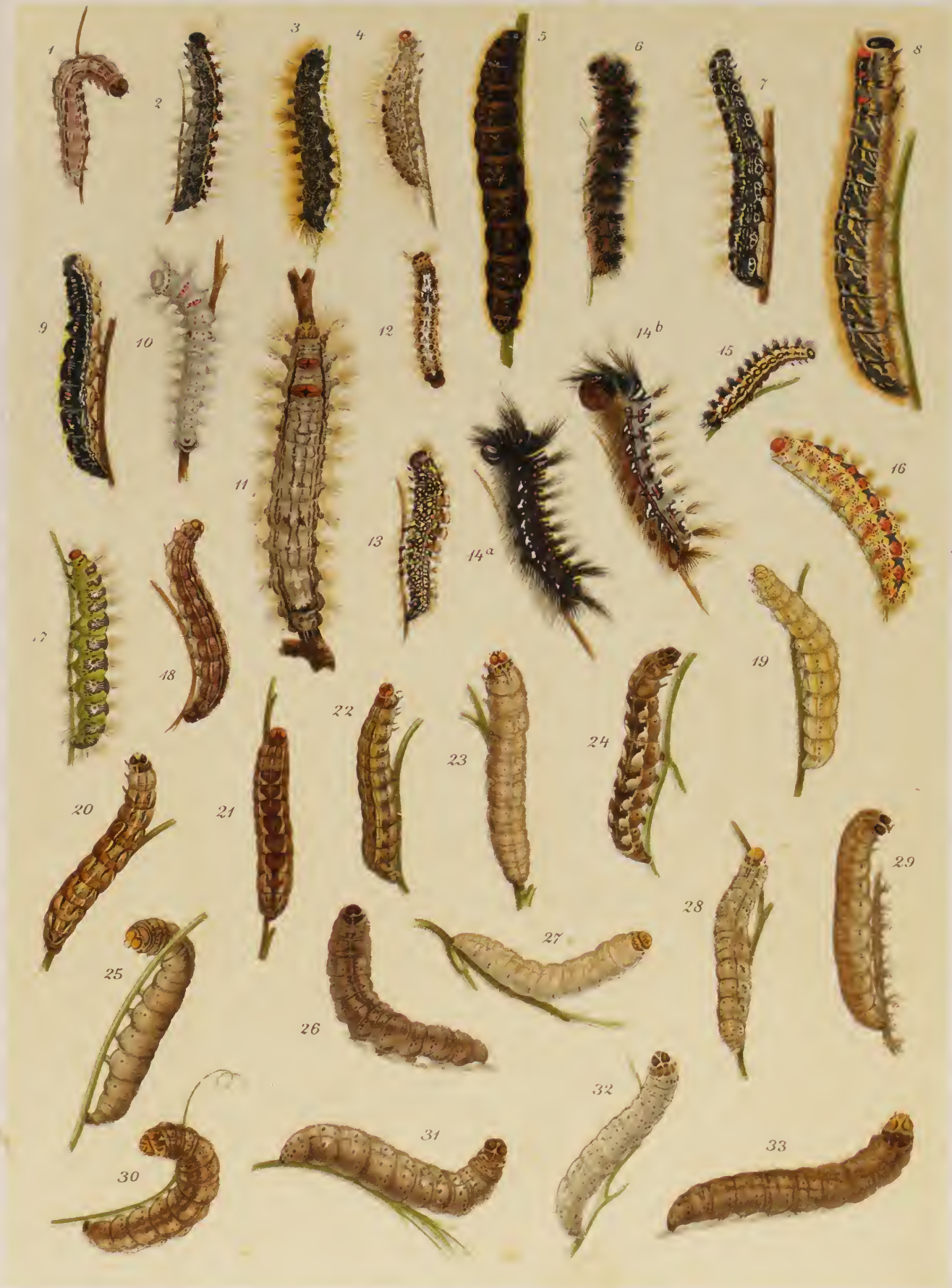
J. Griebel del