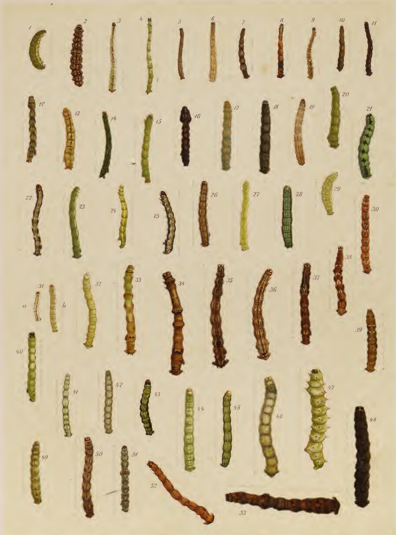
J. Gruebel del.