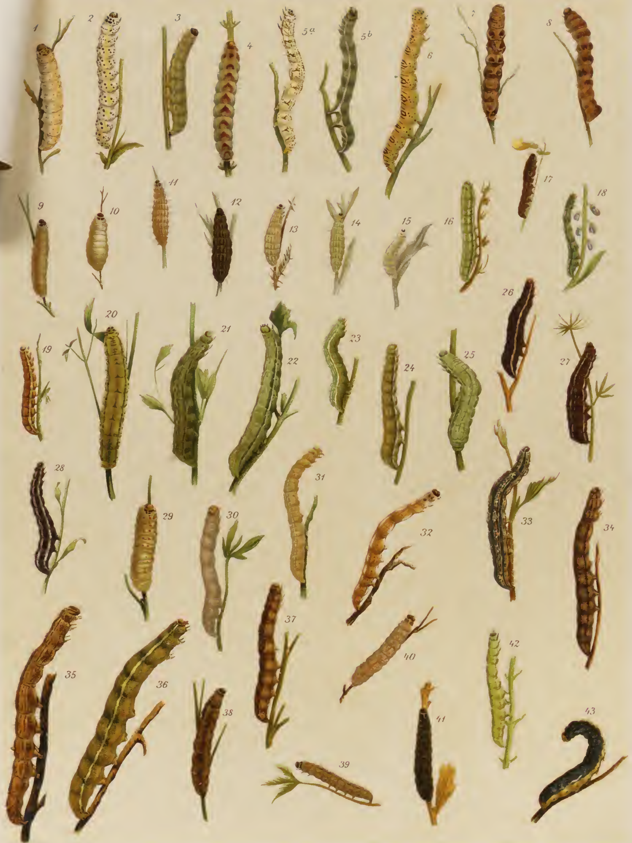
J. Gnebel del