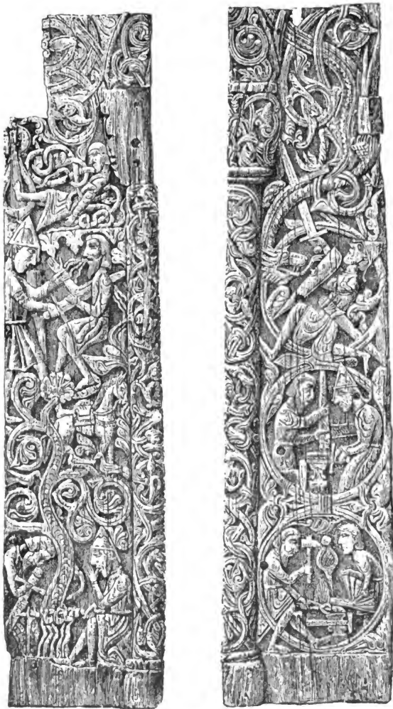
Tafel I. Die Holzthüren von Gyllestad. Vergl. Seite 76.