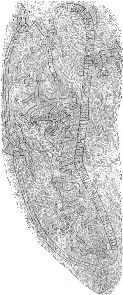
Tafel II. Der Hamfund-Stein. Vergl. Seite 77.