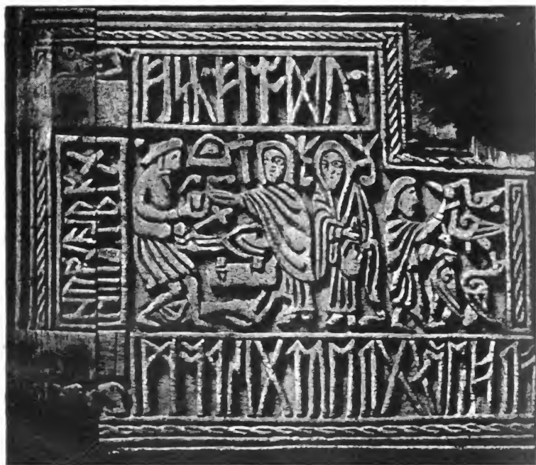
Tafel III. Die Welandscene auf dem angelsächsischen Runenkästchen. (Franks Casket).

Nach Originalphotographie. Vergl. Seite 162.