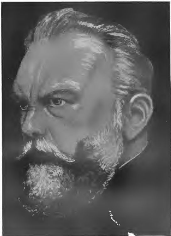
Porträtredierung Karl Lamprechts von Max Klinger aus KARL LAMPRECHT, Ein Gedenkblatt von WILHELM WUNDT und MAX KLINGER. / Verlag von S. Hirzel in Leipzig