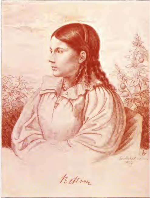
Bettina von Arnim.