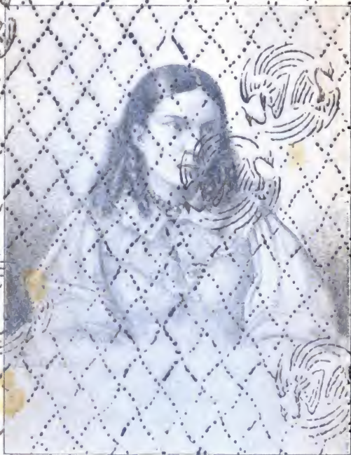
Beata von Aralm. Nach einem Kupferstich von A. G. Müller von Jahre 1809.