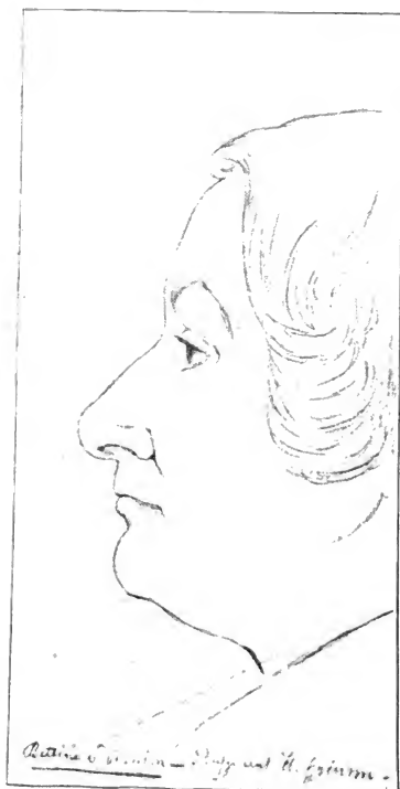
Bettina von Arnim. Bildniszeichnung nach L. Grimm.