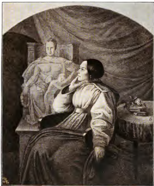
Bettina von Arnim.