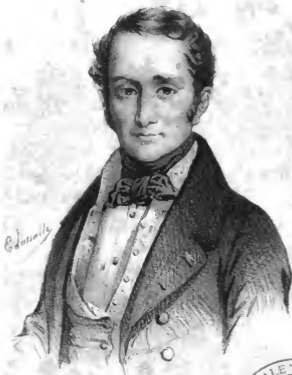
M. DE BROGLIE.