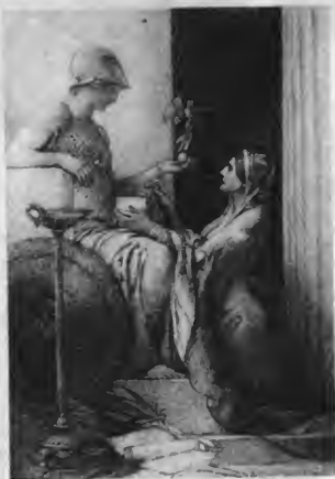
LELAND STANFORD JUNIOR UNIVERSITY