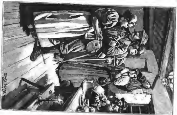
In der Gewerkschafts-Versammlung des Jahres 1872. Nach der Zeichnung von J. B. Schmitt.