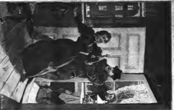
So im Original, "Der seltsame Mann" von Gustav Kautz (1896) Clichéausgabe von D. Kautz.