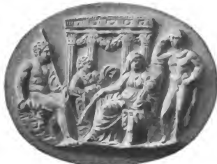
Sardonyx in Florenz (nach Furtwängler, Die ant. Gemmen Taf. LVIII 6)