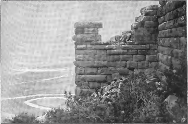
1. Turm an der Ostseite der Akropolis von Priene (nach Wiegand und Schrader, Priene)