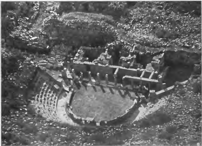
2. Theater in Priene von der Akropolis gesehen (nach Wiegand und Schrader, Priene)