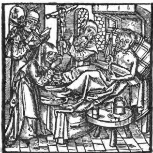
Sterbescene aus dem Seelengärtlein.

1. Zuerst soll man sich kehren zu Gott mit wahrer Reue; 2. sich aller zeitlichen Dinge entschlagen; 3. sich kehren zu den fünf heiligen Wunden Christi, in das liebentflamte Herz Jesu; 4. sich opfern als