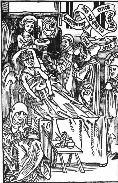
Titelbild der 1489 gedruckten Ausgabe der Versehung .

Ich konnte die Ausgabe von 1509 benutzen, welche, so weit bis jetzt feststeht, nur noch in einem einzigen Exemplar vorliegt, nämlich dem der fürstlich Ottingen-Wallerstein'schen Fideikommiß-Bibliothek zu Raibingen 1) .