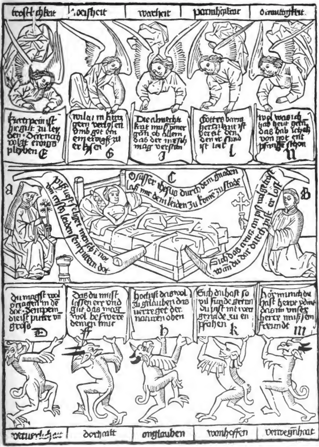
Fachmife nach Feigel-Zestermann.