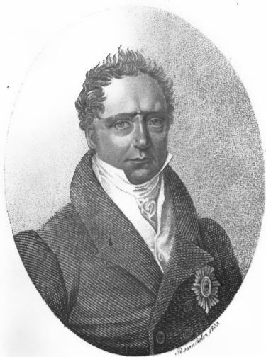
CHRISTIAN GRAF VON BERNSTORFF Kön. preuss. Staats- und Cabinets-Minister.