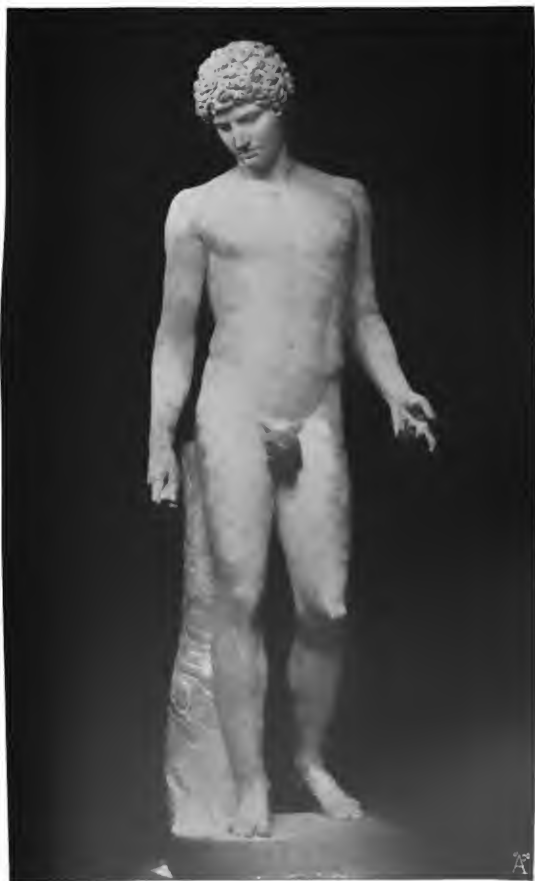
Antinous, aus dem Capitolinischen Museum, Rom