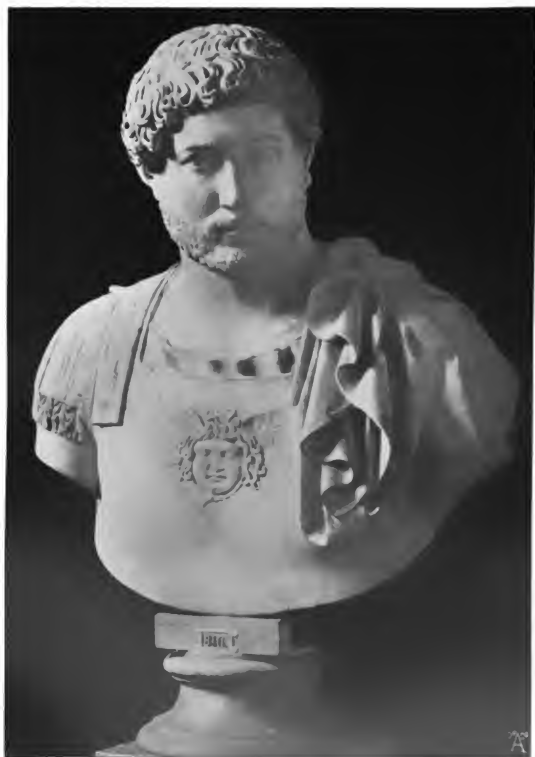
Hadrian, aus dem Berliner Museum