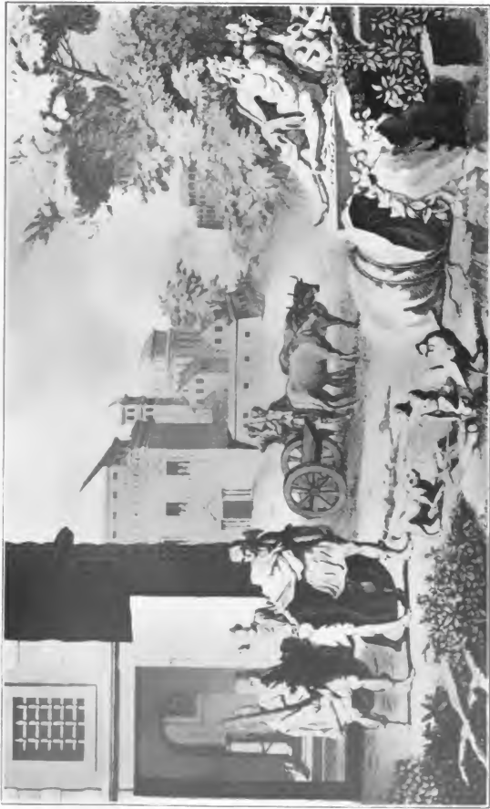
Die Erklärung zu diesem Bilde siehe auf Seite 492 (Nr. 3717)