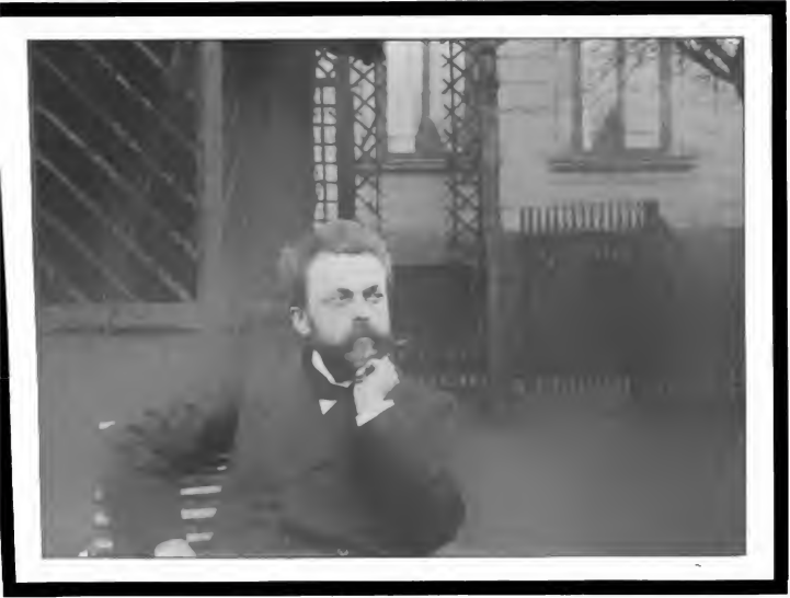
Max Spohr 1850—1905