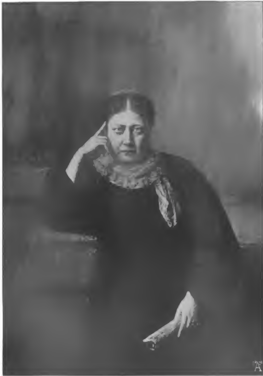
Madame Blavatzky nach einem 1885 zu London angefertigten Gemälde von H. Schmiechen