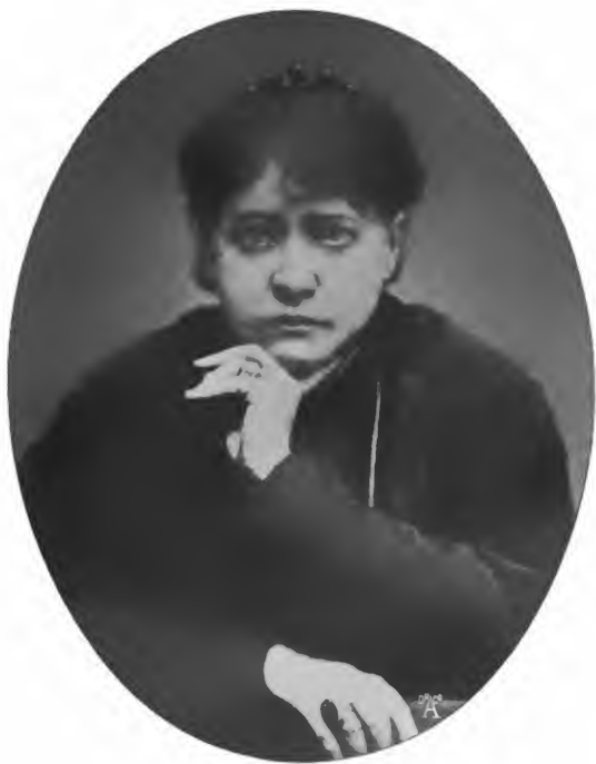
Jugendbildnis Madame Blavatzky's