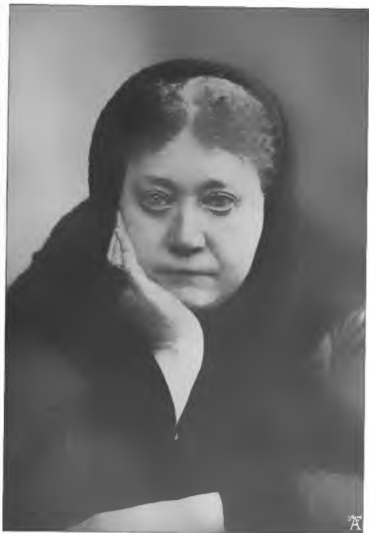
Madame Blavatzky 1831—1891