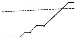
3. Vuks \grave{\text{a}} in \grave{\text{a}}(\acute{\text{a}}) ;