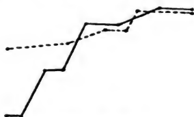
2. Vuks \acute{\text{a}} in \acute{\text{a}}(tac) ;