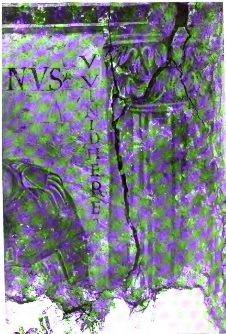
der S. Sylvesterkapelle zu Goldbach.