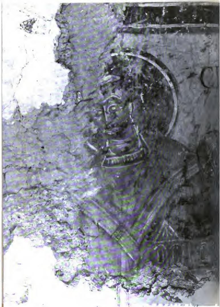
Tafel I. Das Stifterbildnis vom Choro