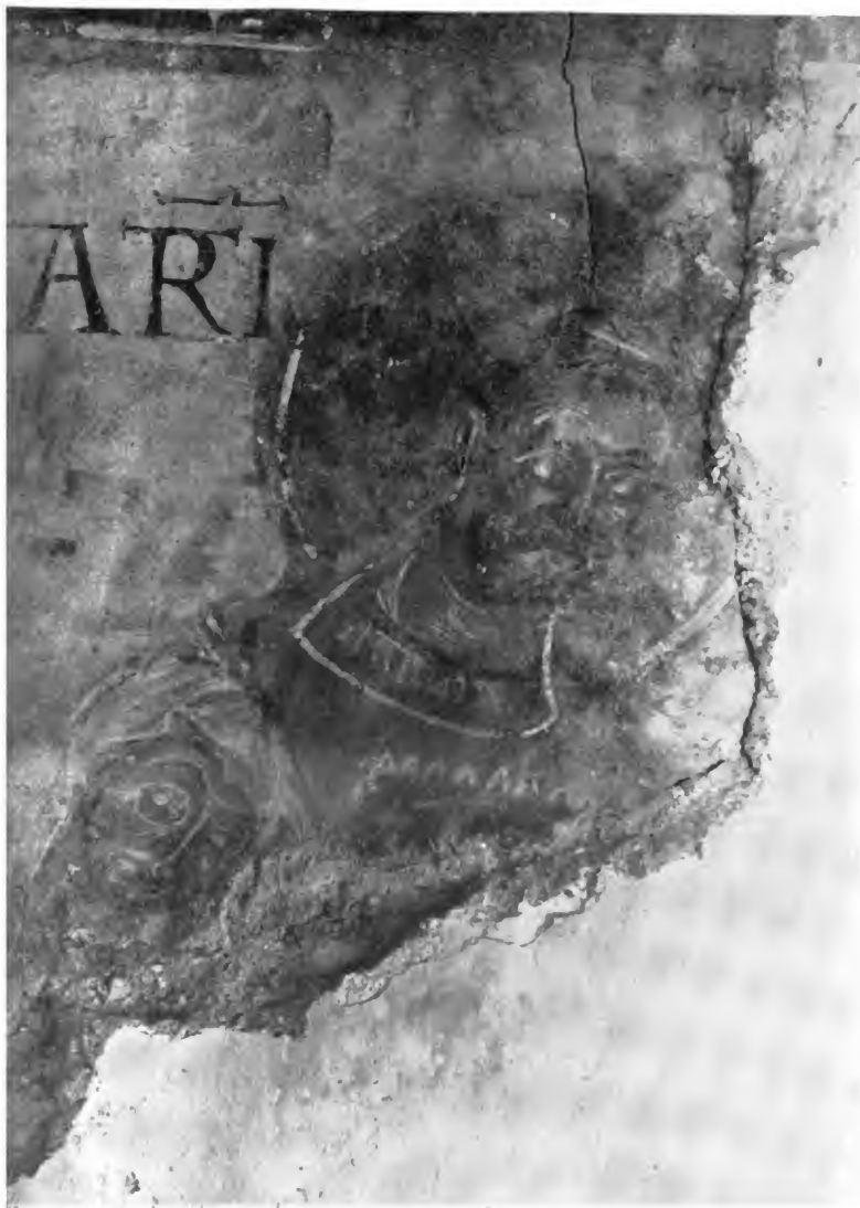
der S. Sylvesterkapelle in Goldbach.