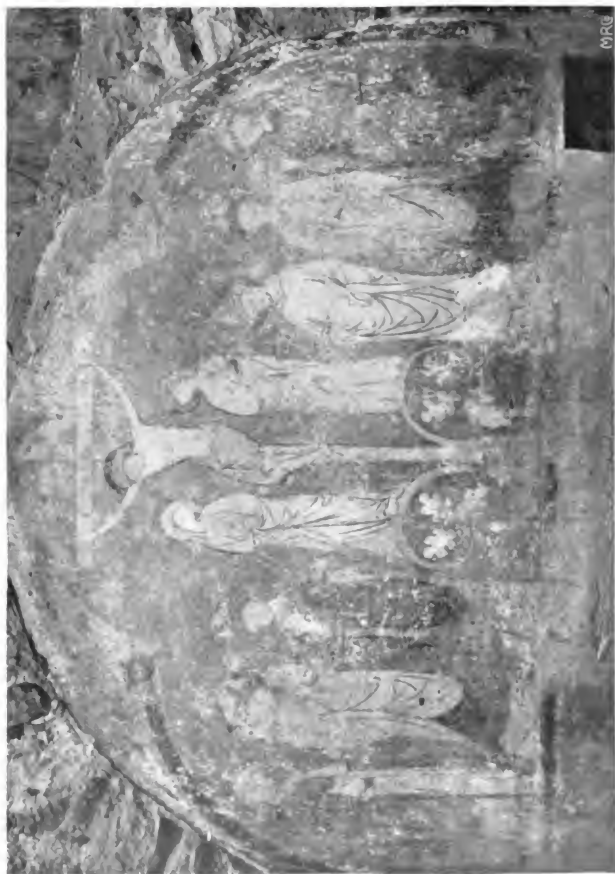
Tafel III. Wandgemälde, ehemals im Dominikanerkloster (jetzigem Inselhotel) zu Konstanz.