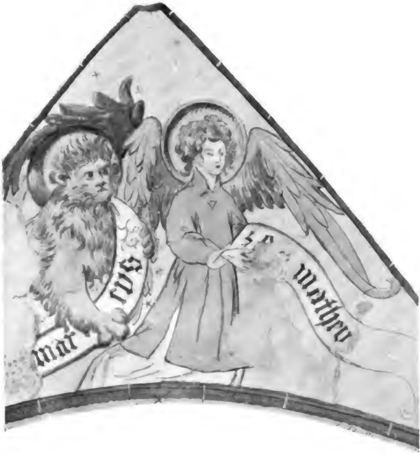
Tafel VIII. Wandgemälde in der Turmhalle der Kirche zu Nußbach.