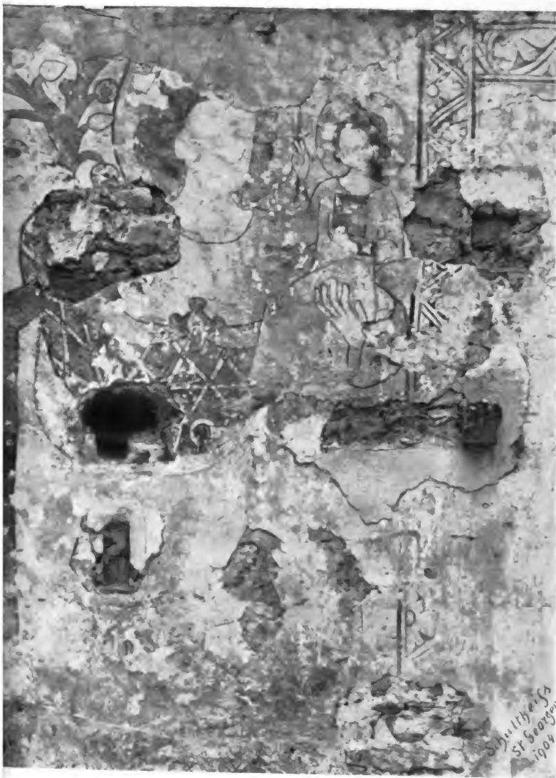
ll, jetzt in den städt. Sammlungen zu Villingen.