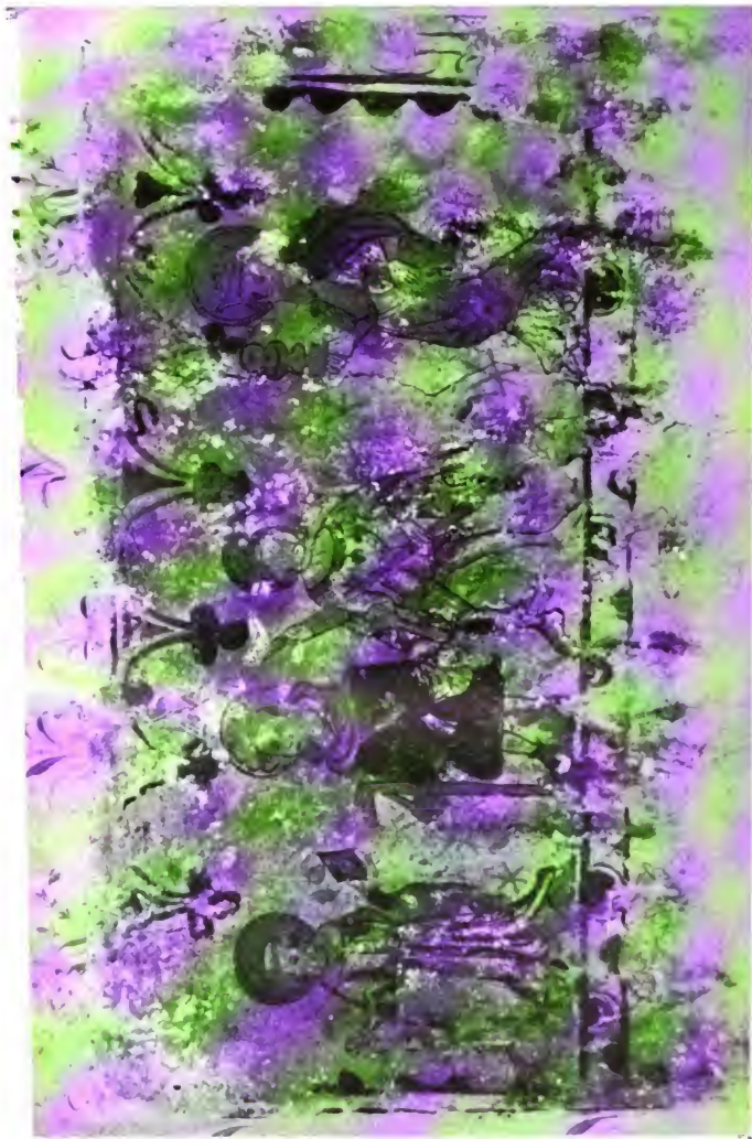
Tafel V. Wandgemälde im Schaller'schen Hause zu Konstanz.