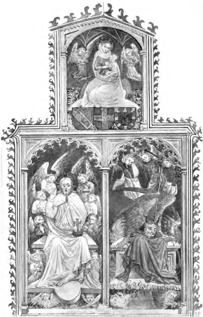
Tafel VII. Wandgemälde in der Margarethenkapelle des Münsters zu Konstanz.