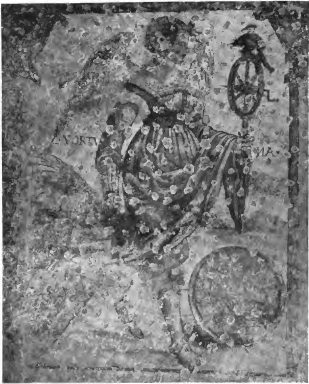
Tafel X. Ein abgenommenes Stück der Wandgemälde, ehemals im Haus Zum Steinbock, jetzt im Rosgarten-Museum zu Konstanz.