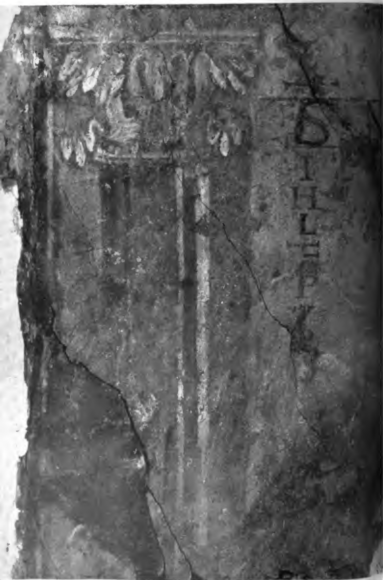
Tafel II. Das Bild der Stifterin vom Chor