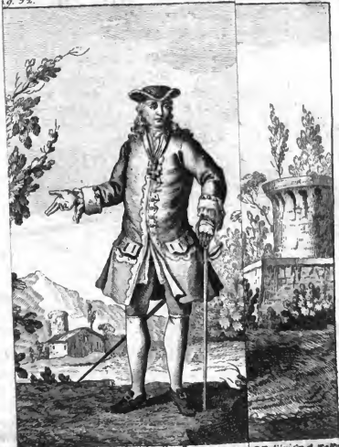
Cavaliere dell'Aquila Rossa.