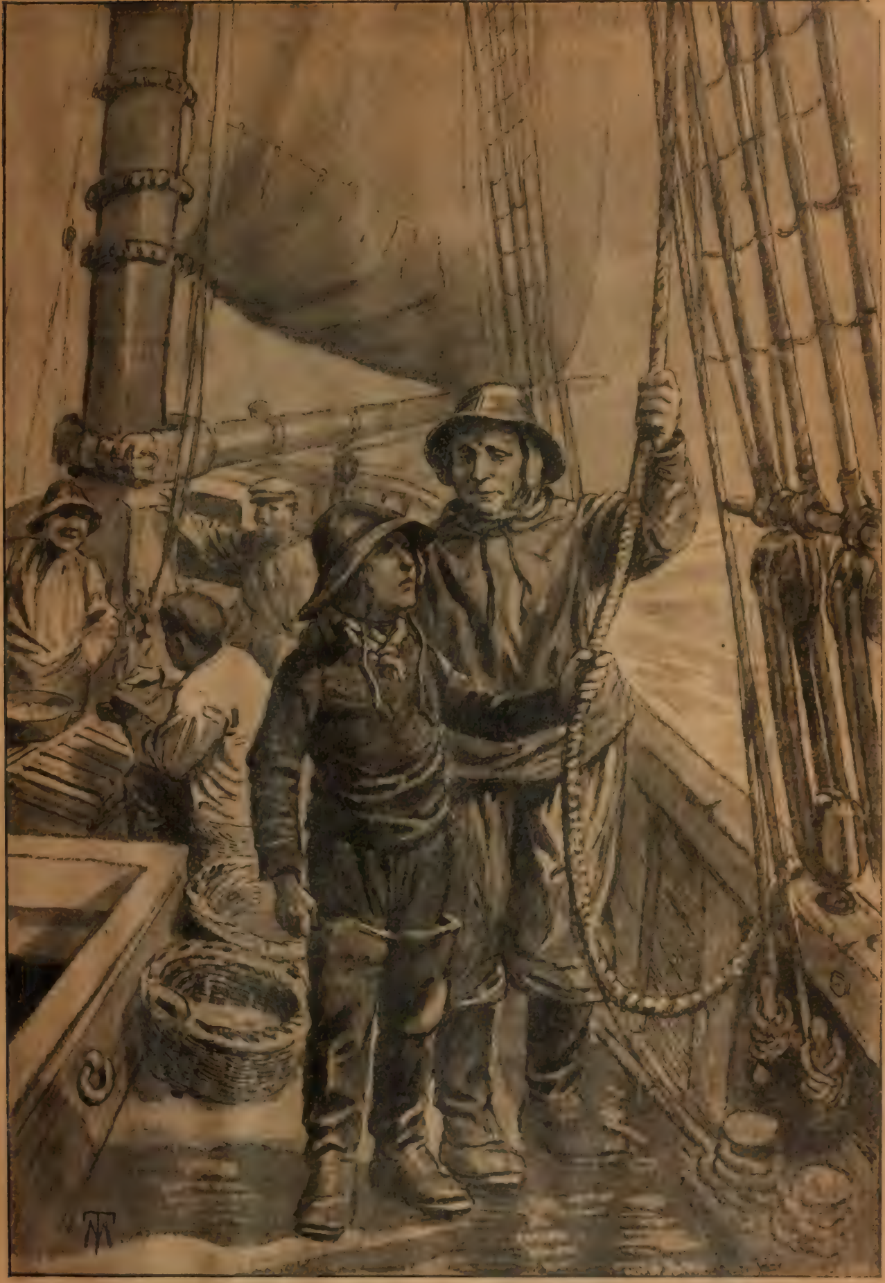
PENDANT UNE HEURE, LONG JACK PROMENA SA PROIE DE HAUT EN BAS, LUI ENSEIGNANT LES CHOSES QU'A LA MER TOUT HOMME DOIT CONNAITRE... (p. 20.)