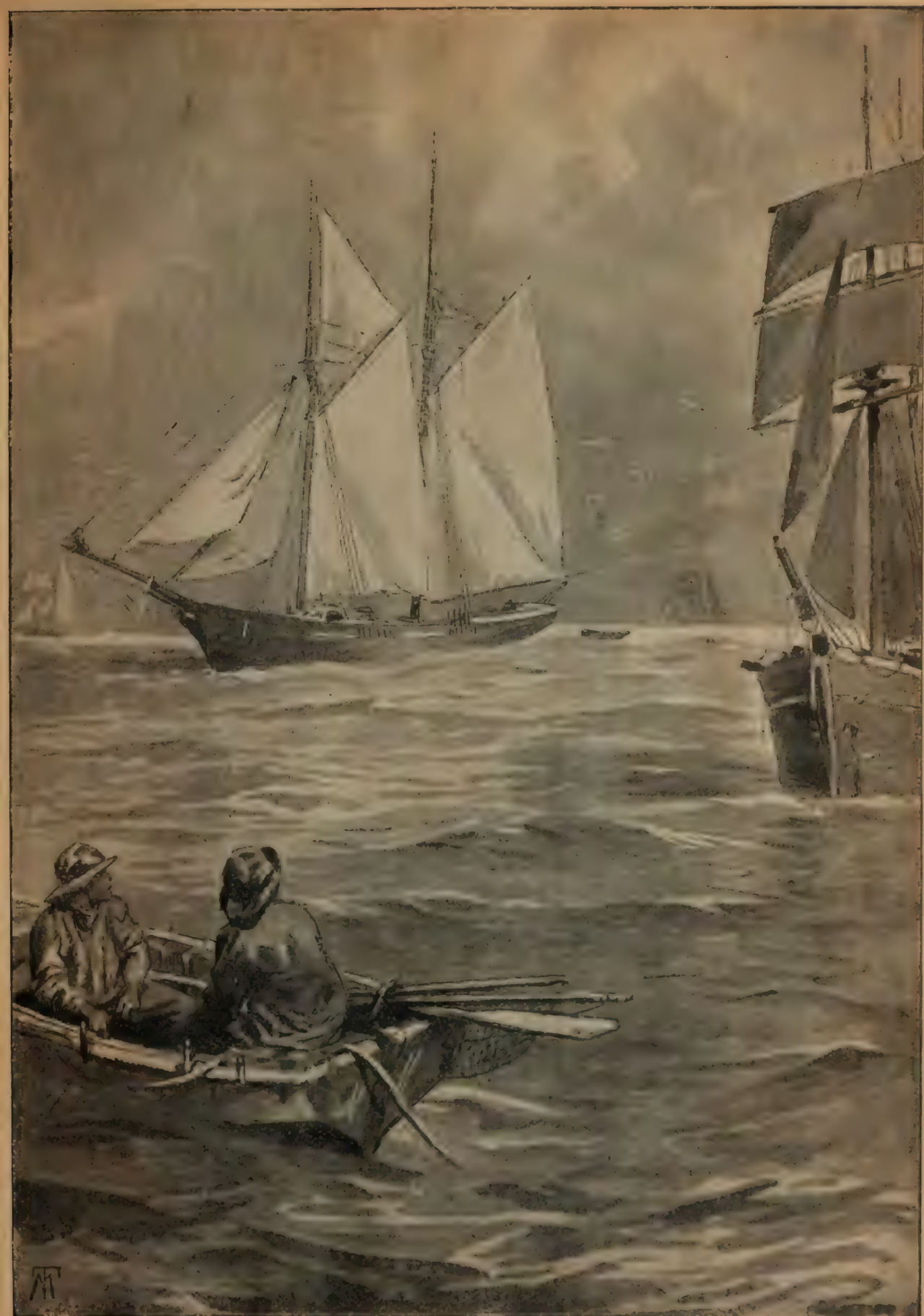
ILS S'EN ALLERENT DE MOUILLAGE EN MOUILLAGE VERS LE NORD, PÊCHANT SANS DISCONTINUER. (p. 44.)