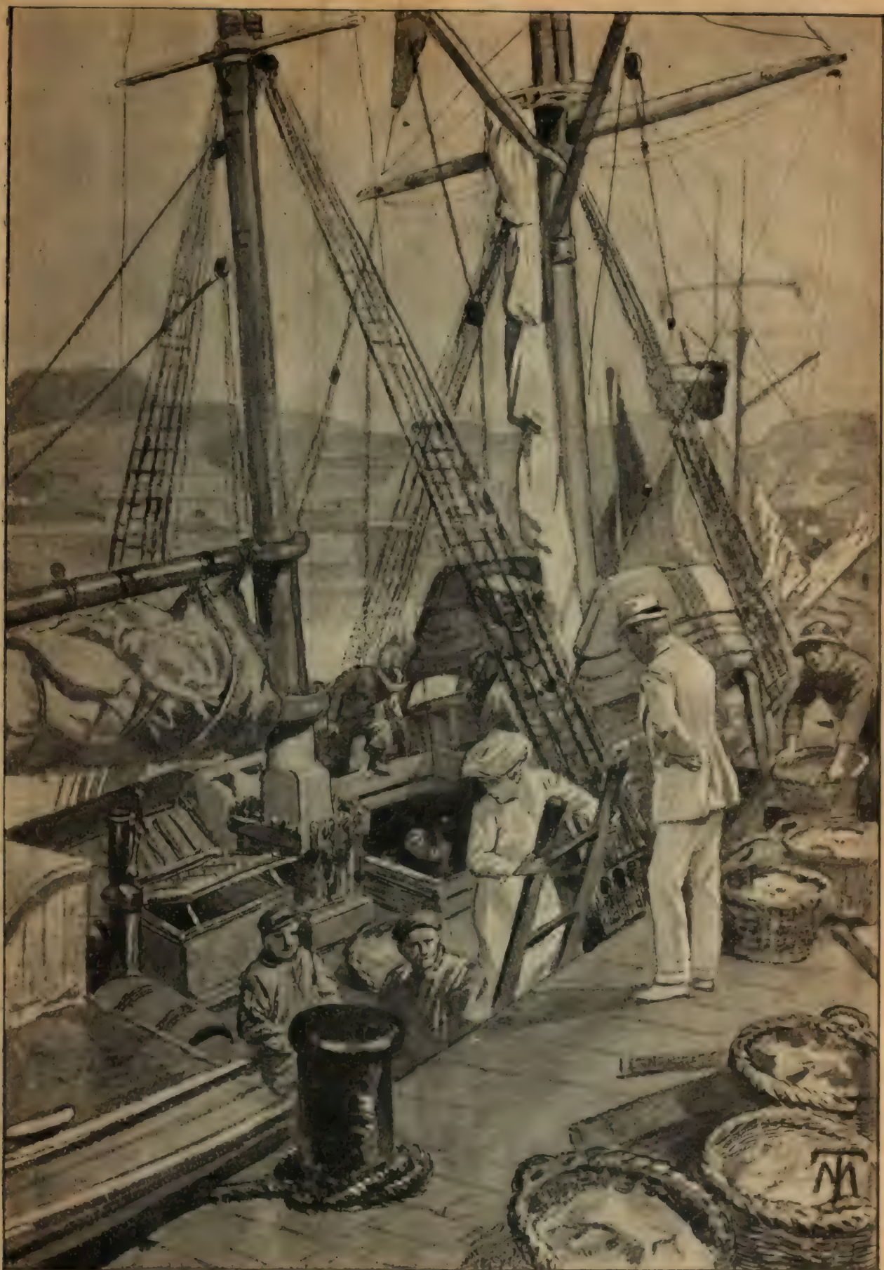
LA MÊME FEMME, QUI NE POUVAIT PAS SOULEVER LA TÊTE HUIT JOURS AUPARAVANT, DESCENDIT TANT BIEN QUE MAL PAR L'ÉCHELLE. (p. 67.)