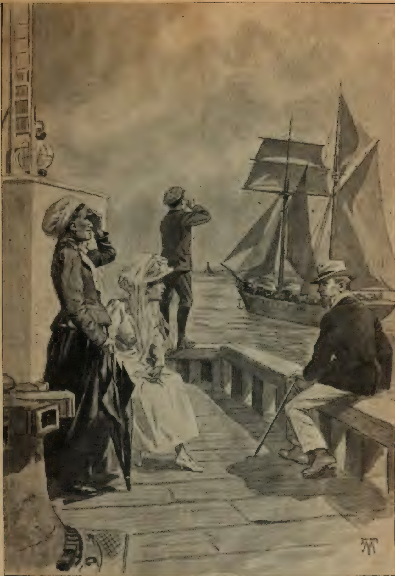
TUIS ELLE GLISSA HORS DE PORTÉE DE VOIX ET ILS S'ASSIRENT POUR REGARDER LA GOÉLETTE SORTIR DU PORT. (p. 80.)