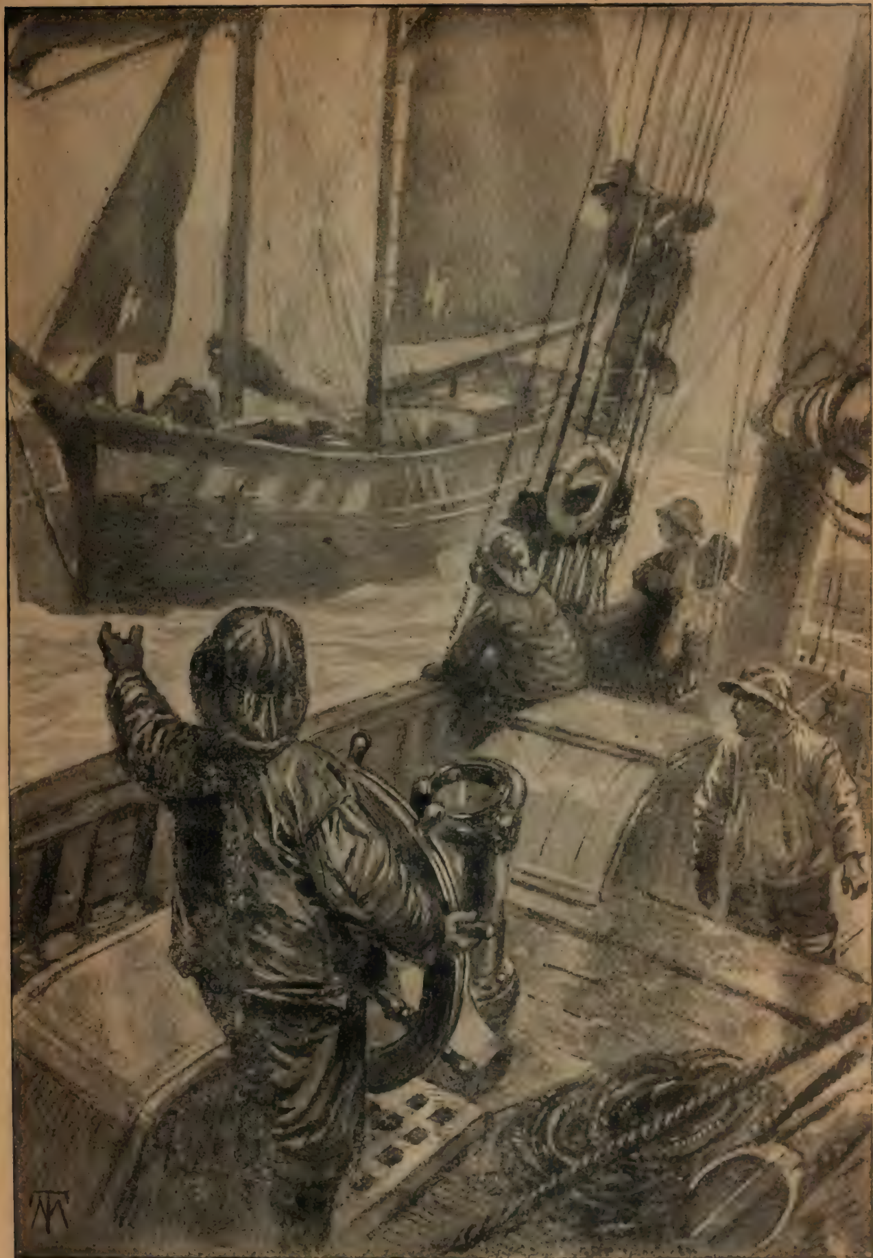
UNE BARBE GRISE BRANLA PAR-DESSUS LE BORDAGE, ET UNE VOIX ÉPAISSE HURLA QUELQUE CHOSE QUE HARVEY NE PUT COMPRENDRE. (p. 36.)