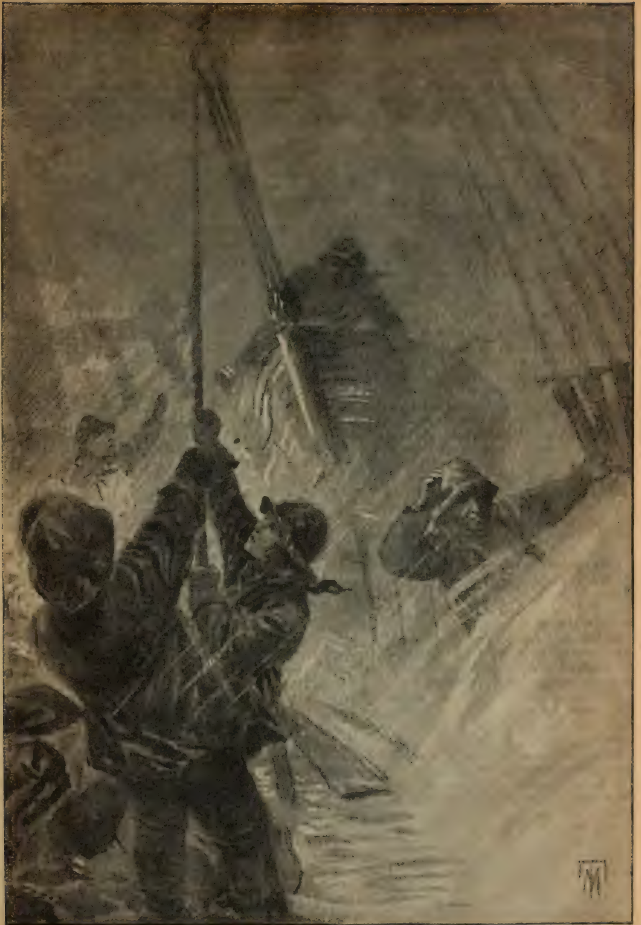
ILS AGRIPPAIENT AU MOYEN D'UN CROC ET HISSAIENT A BORD UN HOMME TREMPÉ ET UN BATEAU A DEMI-SOMBRÉ. (p. 54.)