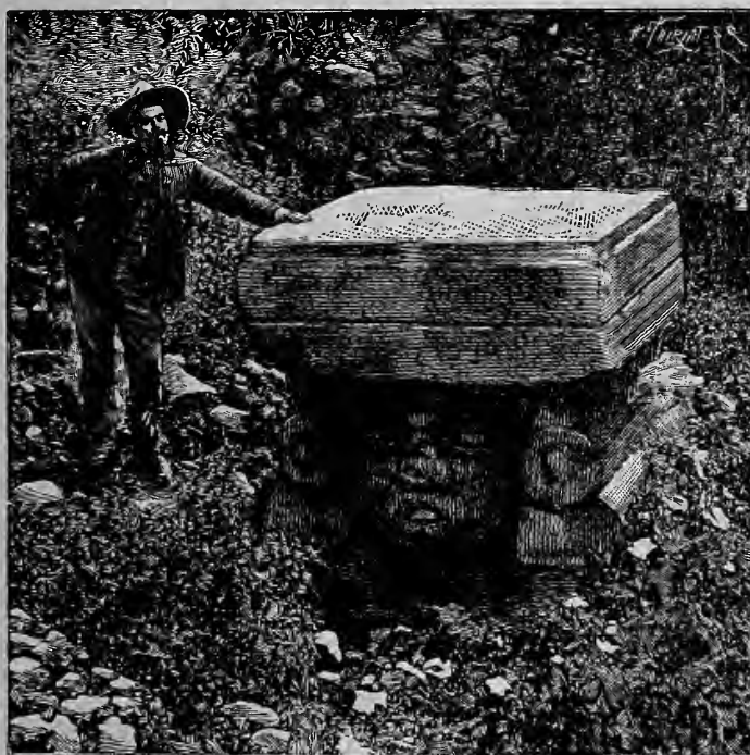
"Diosa del Agua." MONOLITO DE TEOTIHUACAN.