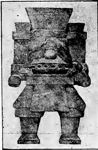
MONOLITO de COATLINCHAN Dibujo del Sr. José M. Velasco.

Quien incurre en falsedad al asegurar que el monolito no tiene un brazo roto, es el Sr. Chavero; y para probarlo, reproduzco la fotografía que presenta al monumento en posición que deja ver, con toda claridad, que tiene el brazo izquierdo roto.