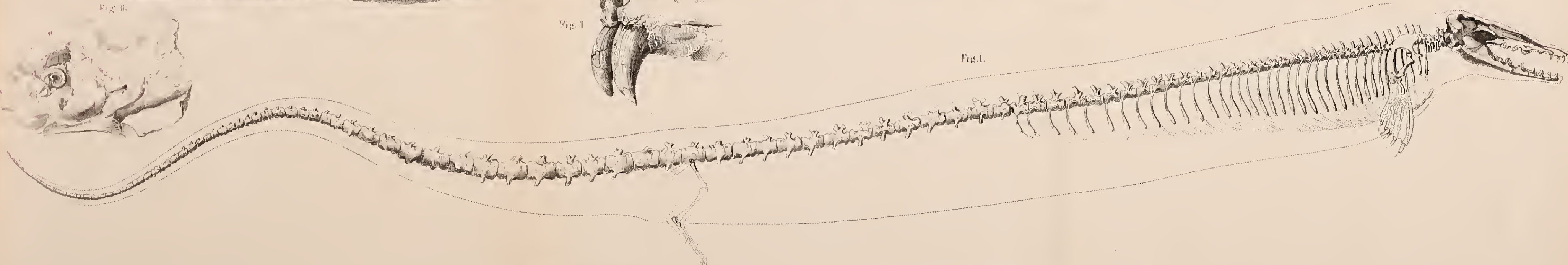
Fig. 1. Skelet von Zeuglodon macrospondylus.