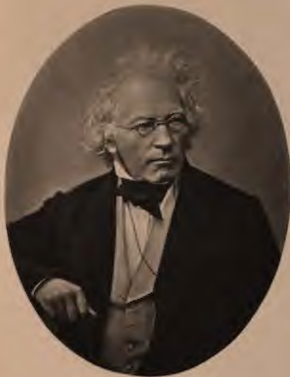
Alte Mann (Museum) 1840-1841