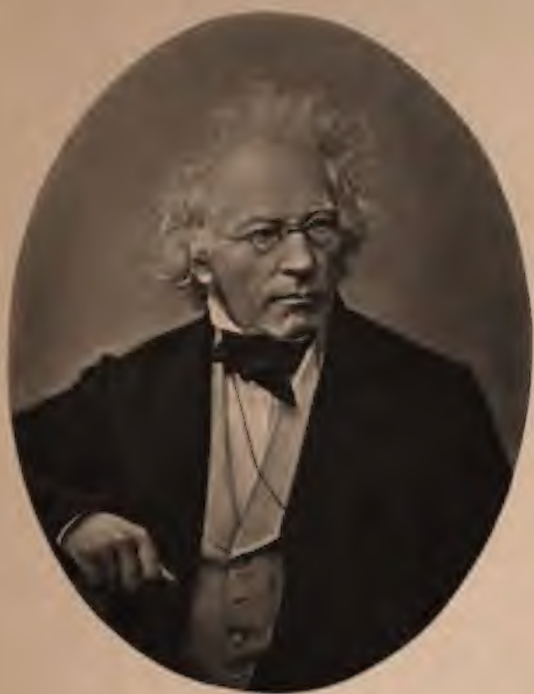
Portrait of the late General Pitt Rivers, R. S. M.