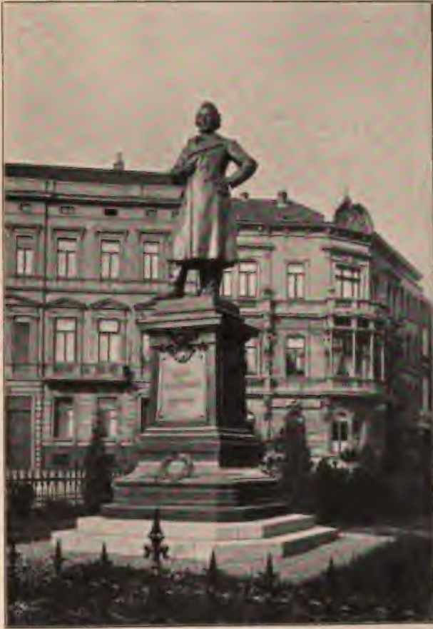
Das Hansemann-Deukmal in Aachen.