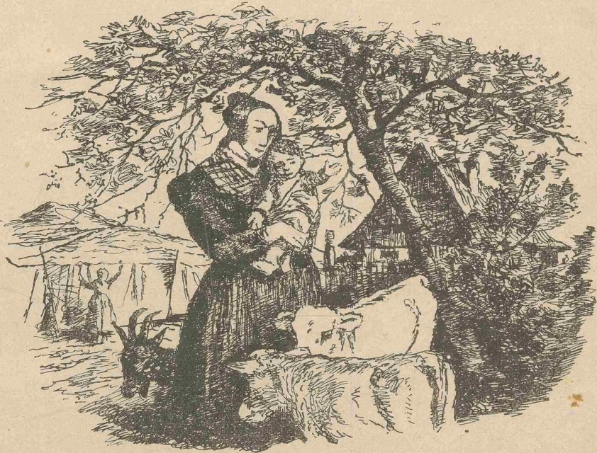
Jedes Kind und jedes Tierlein fühlte sich bei der Tante geborgen (S. 52).

So mußte ich also die Zügel ergreifen. Geändert hat sich nach außen allerdings nicht allzuviel. Doch schickte jetzt die Tante alle Käufer und Verkäufer zu mir, dem Bauern. Ich unternahm aber nie etwas, ohne mit ihr Rücksprache zu nehmen. Am ärgerlichsten war es mir, daß sie sich selbst zu den häuslichen Ausgaben bei mir erst die Genehmigung holte. Dies konnte ich ihr nie abgewöhnen.“