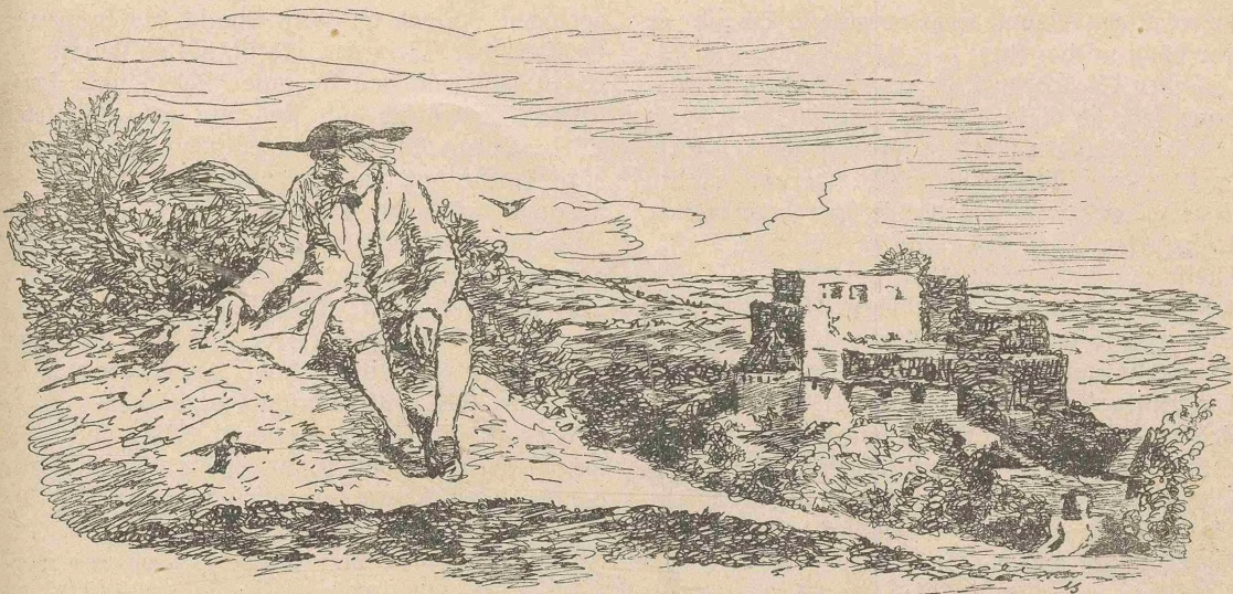
Dann wieder lockte er den Finken und Meisen (S. 50).

zwei Jahre in dem Orte und kann seine Leute nicht mehr vergessen. Zwei Jahre in der Gegend und jeder Stein und jeder Baum spricht zu mir! Und wenn ich um mich schaue, Hans, dort der Hohenstaufen! Blickt er nicht wie ein großer Grabhügel herüber? Und hier der Rechberg! Wie ein zweihöckeriges Kamel lagert er friedlich in dem Grün der Wiesen. Und da der Stuißen, der Hornberg und der Rosenstein! O, da möchte ich sie alle an mein Herz drücken, die großen, harten Berge! Da fühle ich erst mit Stolz, was es heißt, Mensch zu sein; denn nur wir Menschen können die Heimat lieben!“