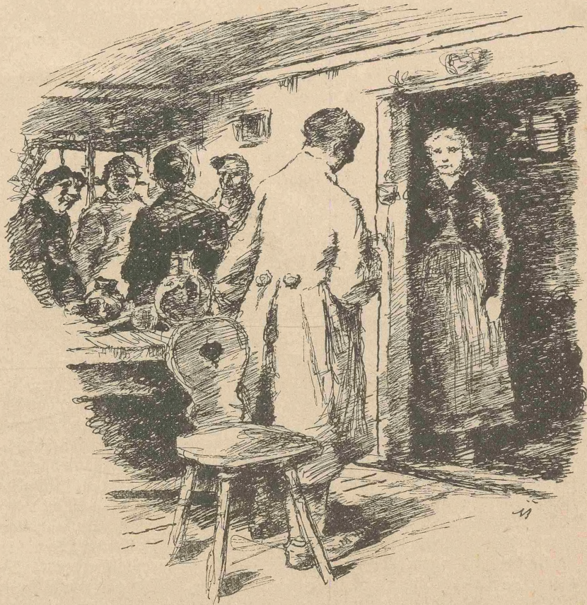
Als die Besichtigung zu Ende war, kam die Lene herein (S. 57).

Waren es auch nur gleichgültige Dinge, die wir besprachen, so merkte jetzt die Lene doch — sie hätte kein weibliches Wesen sein müssen —, was mich in den Hof geführt hatte. Sie wurde plötzlich zurückhaltender, scheuer, immer auf Abwehr eingestellt, wo es doch nichts zum Abwehren gab. Aber das ist gerade das Zeichen eines unverdorbenen Mädchens, daß es bei der geringsten Ge-