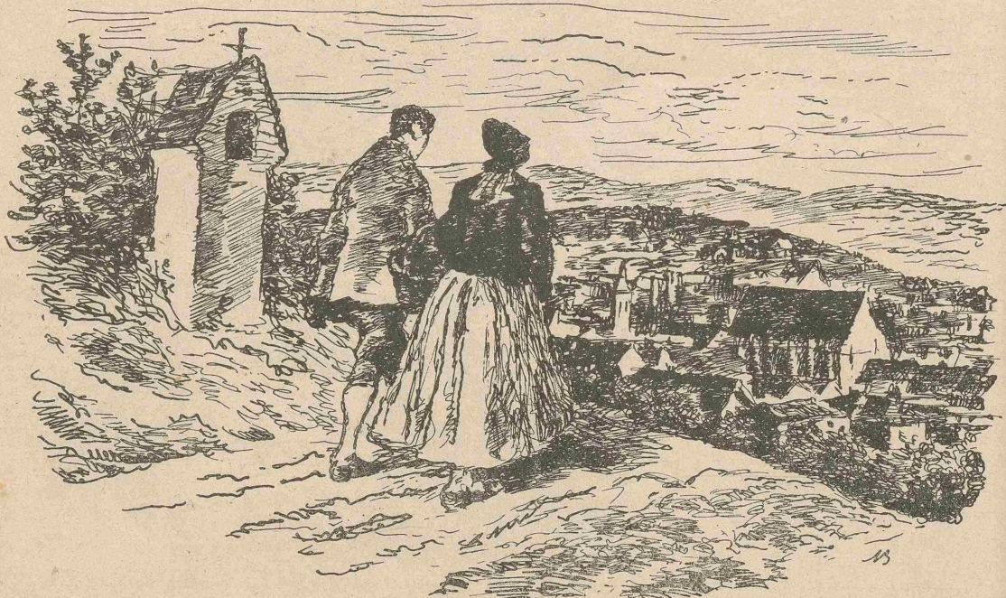
Bald sahen wir drunten im Remstal Gmünd liegen (S. 54).

ebenso schön wie in diesem Jahre, und die Vögel fangen so froh und lustig, daß es mir ganz wohl ums Herz wurde. Die Tante fing aber alsogleich an, laut den Glorreichen Rosenkranz zu beten.