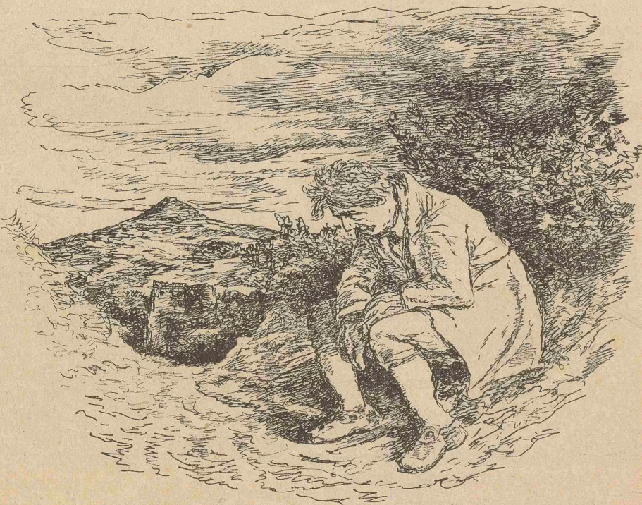
Als ich noch einmal zurückschaute, erschien mir die Gestalt des Hans wie das Steindenkmal eines gescheiterten Lebens (S. 61)

In viele Stücklein zerschlagen ging der schöne Hof des Baldenbauern, den Duzende von Geschlechtern sich erarbeitet hatten, in fremden Be-