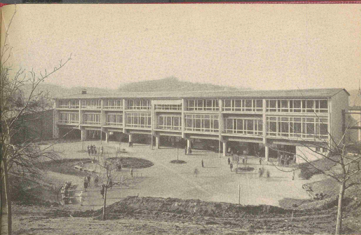
Die 1952 eingeweihte Rauchbeinschule von Süden; Architekt Wolf Irion