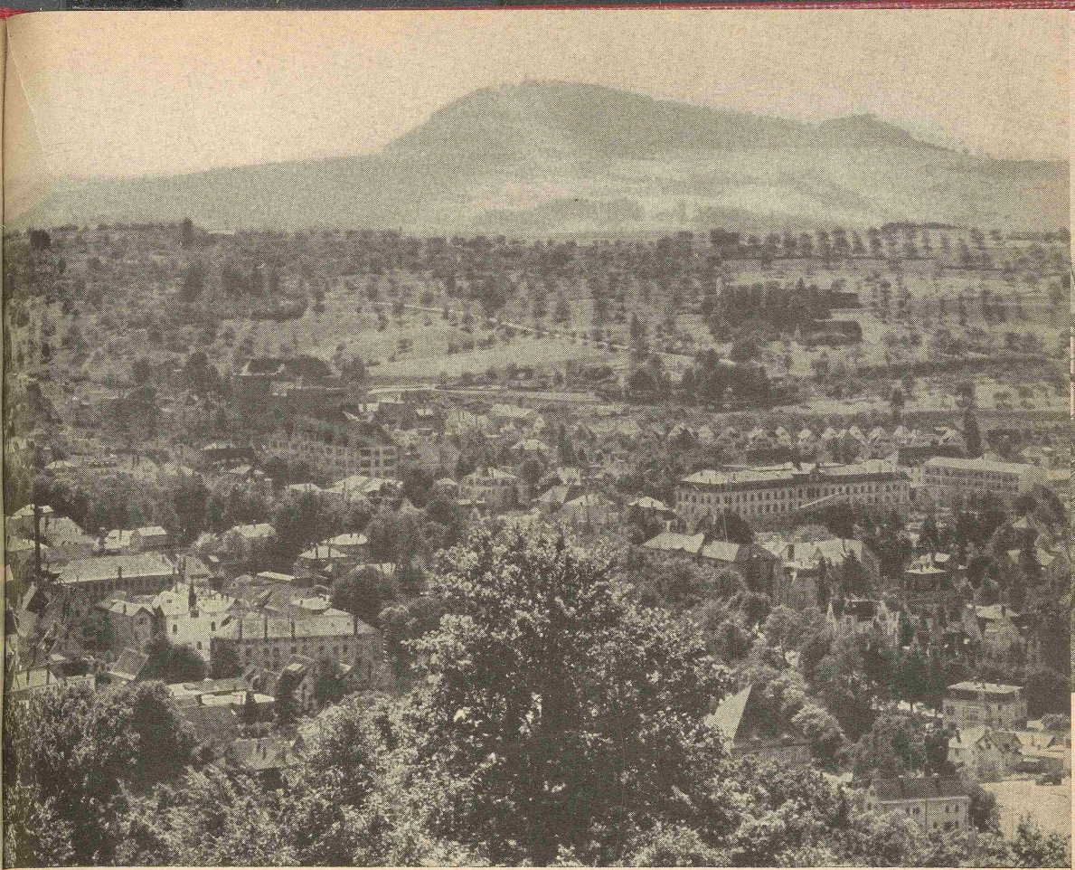
Blick vom Lindenfirst auf den westlichen Stadtteil mit seinen großen Schulgebäuden.