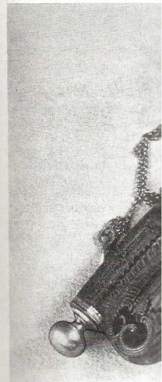
Geschnitzte Pfeifenköpfe mit Silber

Da nun nicht jeder sich Schmuck leisten konnte, ging man bald zur Herstellung von billiger Ware aus Tommeten über. In der Mitte des 18. Jahrhunderts hatte die Schmuckwarenproduktion in Schwäbisch Gmünd ihren höchsten Stand erreicht. In der Stadt lebten nicht weniger als 250 Goldschmiede, darunter Gesellen und Lehrlinge nicht zu zählen. Größer sogar war die Zahl der in diesen Berufen verwandten Berufen. Dann aber ging es rasch abwärts.