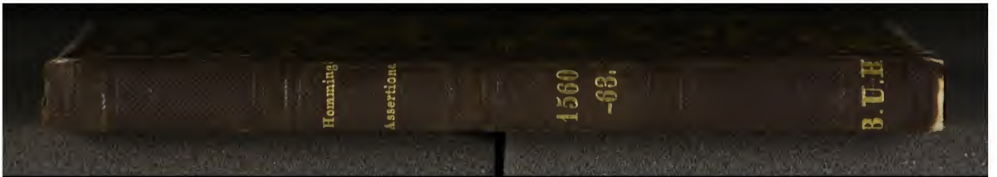
Th. 451 12 8° (LN 774)