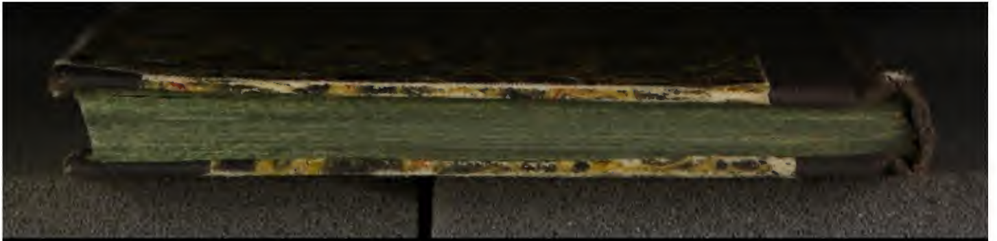
Early European Books, Copyright © 2009 ProQuest LLC. Images reproduced by courtesy of the Royal Library, Copenhagen. Th. 45112 8° (LN 774)