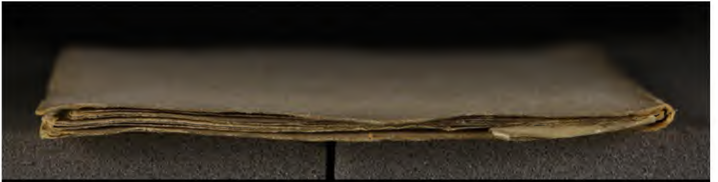
Hielmst. 362 8° (LN 779)