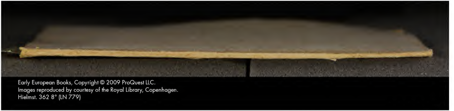
Early European Books, Copyright © 2009 ProQuest LLC. Images reproduced by courtesy of the Royal Library, Copenhagen. Hielmst. 362 8° (LN 779)