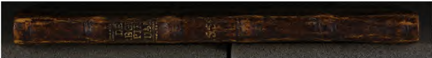
Hielmst. 551 8° (LN 832 8° copy 2)