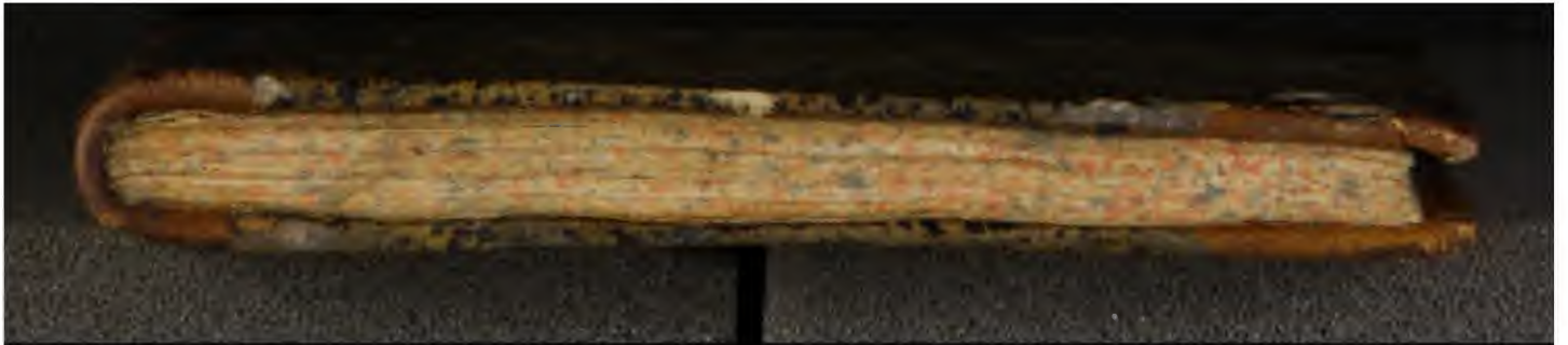
Early European Books, Copyright © 2009 ProQuest LLC. Images reproduced by courtesy of the Royal Library, Copenhagen. Hielmst. 551 8° (LN 832 8° copy 2)