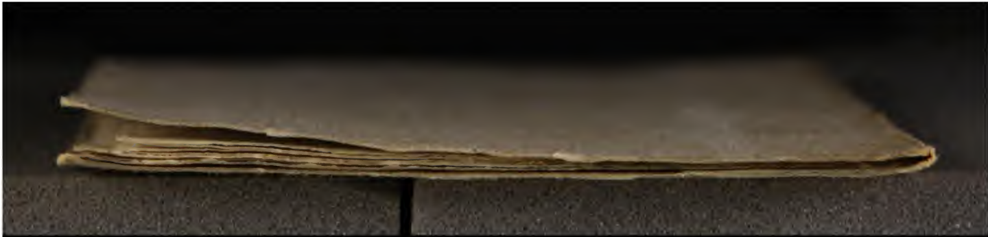
Early European Books, Copyright © 2009 ProQuest LLC. Images reproduced by courtesy of the Royal Library, Copenhagen. Hielmst. 357 8° (LN 776)