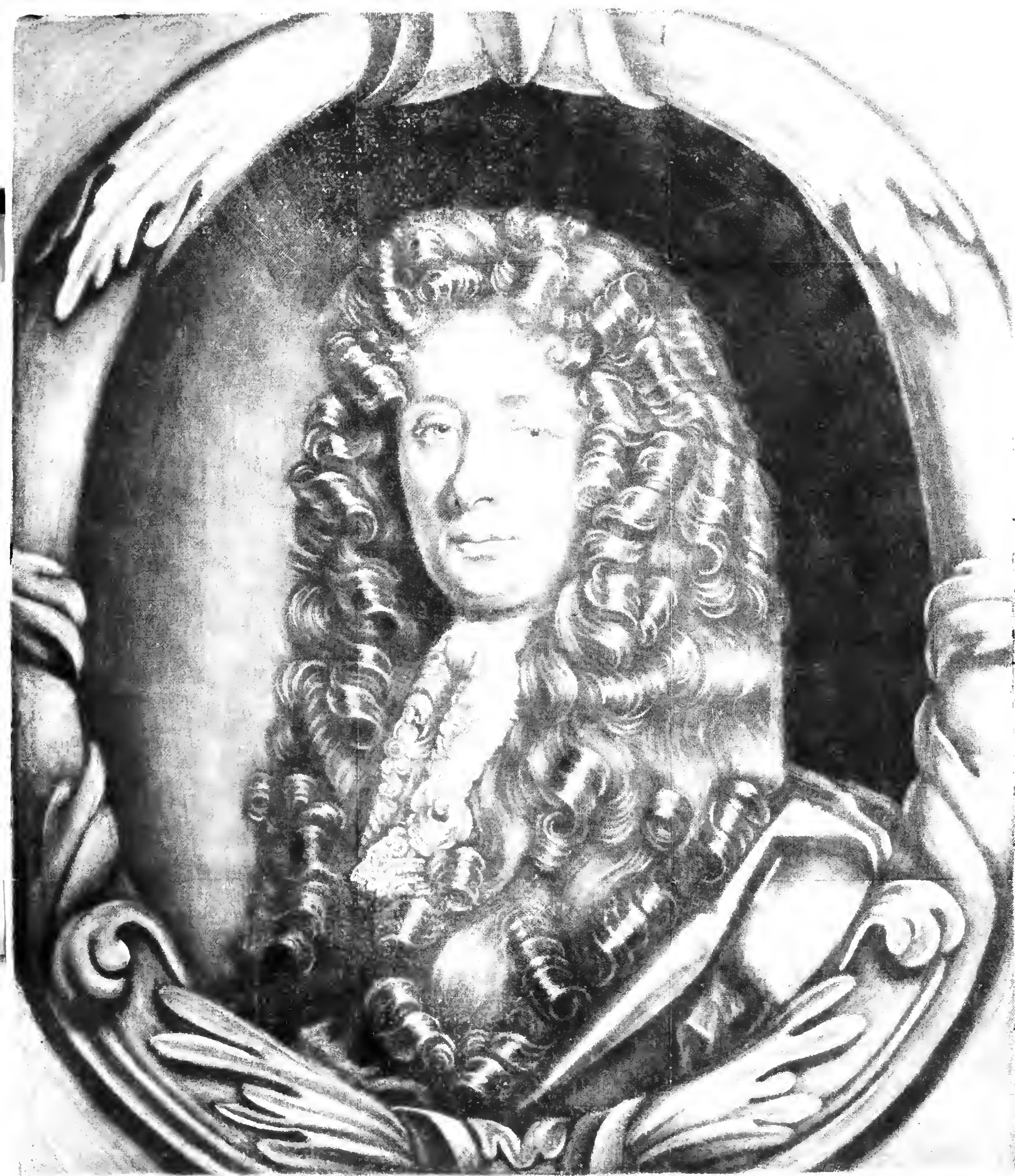
Went. Bertram. J. U. Q. D. Quæ. ou. rest.