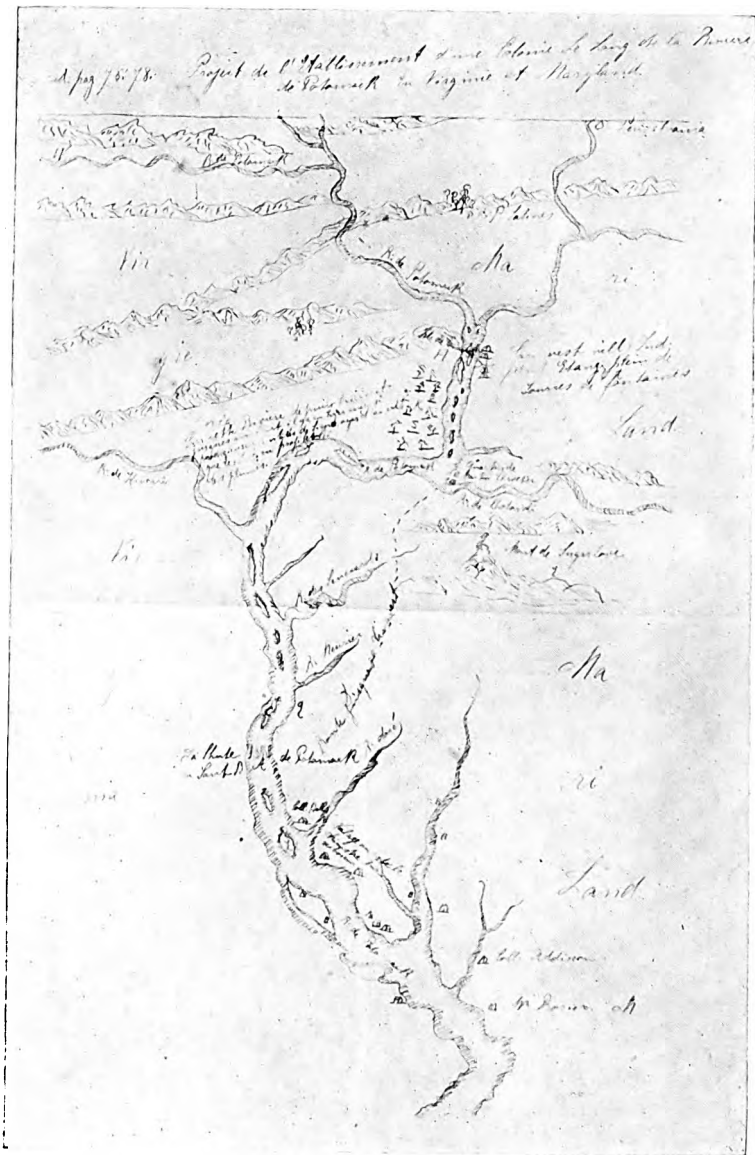
GRAFFENRIED'S MAP OF HIS PROPOSED SETTLEMENT ON THE POTOMAC