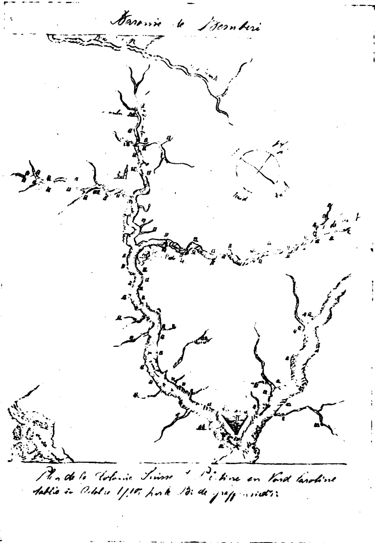
GRAFFENRIED'S MAP OF HIS COLONY